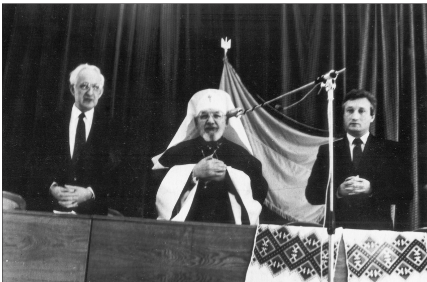
Рис. 4. Установча конференція з відродження УЛТ, Львів, 1990 р. Проф. О. О. Кіцера та проф. В. Й. Кімакович разом з Митрополитом Володимиром Стернюком