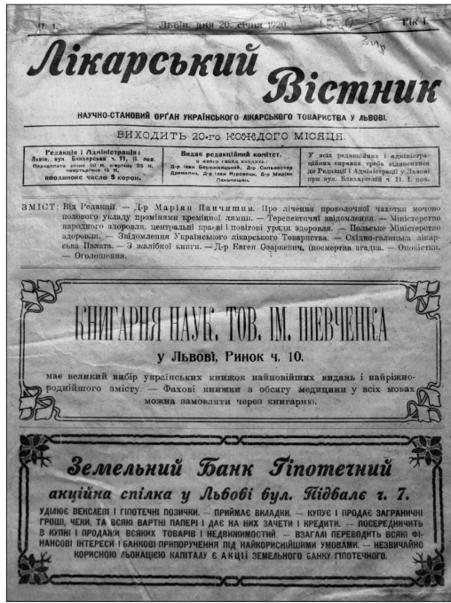
Рис. 1. Обкладинка першого номера «Лікарського вісника», (1920)