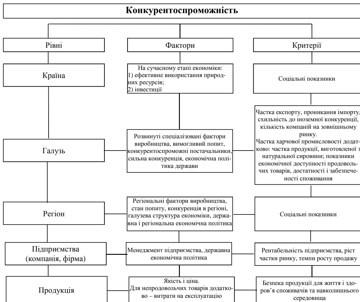
Рис. 4. Рівні, фактори і критерії конкурентоспроможності

Таким чином, розгляд проблем конкурентоспроможності на якому-небудь рівні вимагає обліку впливу всіх вказаних рівнів конкурентних відносин. При цьому кожен рівень конкурентної сфери має властиві йому фактори, або так звані детермінанти конкурентних переваг, особливі критерії, методи оцінювання конкурентоспроможності і стратегію її досягнення. На рис. 4 представлені фактори і критерії конкурентоспроможності залежно від рівня економіки.