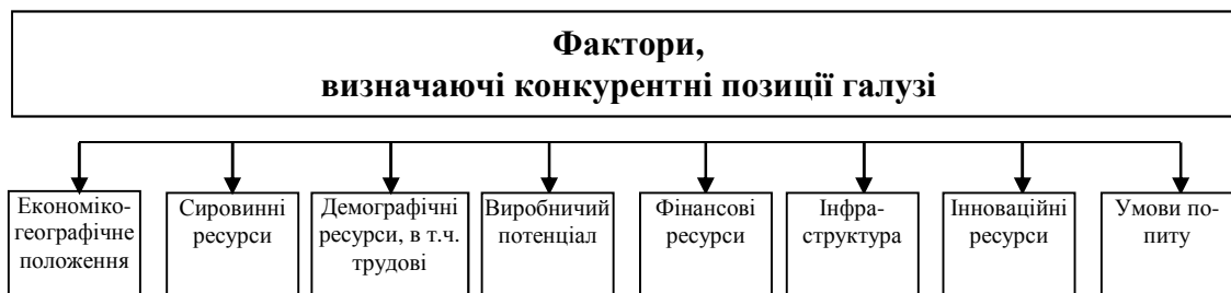
Рис. 3. Фактори, що визначають конкурентні позиції агропромислового комплексу