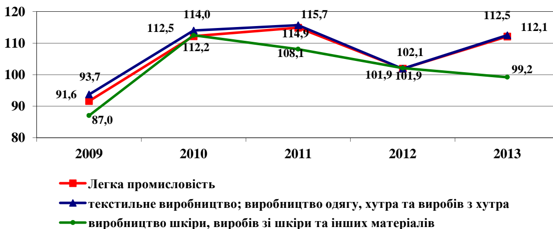
Рис. 1. Динаміка темпів зростання (спаду) обсягів реалізації продукції підприємств легкої промисловості в Україні за 2009–2013 рр., %

Динаміку темпів зростання (спаду) обсягів реалізації продукції підприємств легкої промисловості в Україні за 2009–2013 рр. зображено на рис. 1.