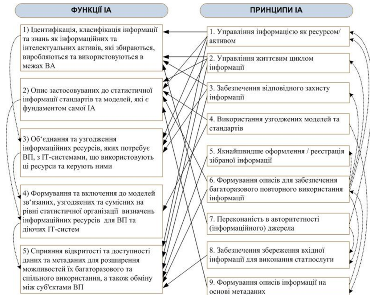
Рис. 2. Схема зв'язку основних функцій з принципами ІА

ставлено не тільки безпосередній зв'язок між функціями та принципами ІА, а й взаємополучення певних функцій і принципів. Це взаємополучення визначає залежність повноти реалізації окремих функцій/принципів від реалізації інших функцій/принципів. На рис. 2 зв'язки між функціями та принципами позначено прямими стрілками, а взаємополучення функцій/принципів – пунктирними заокругленими стрілками.