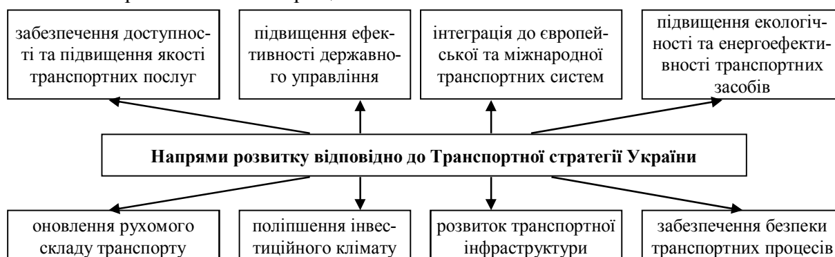
Рис. 2. Напрями розвитку відповідно до Транспортної стратегії України на період до 2020 року Джерело: [9].

ринку транспортних послуг, залучення інвестицій, технічне і технологічне оновлення рухомого складу та інфраструктури, задоволення потреб національної економіки і населення в перевезеннях та покращення їх якості.