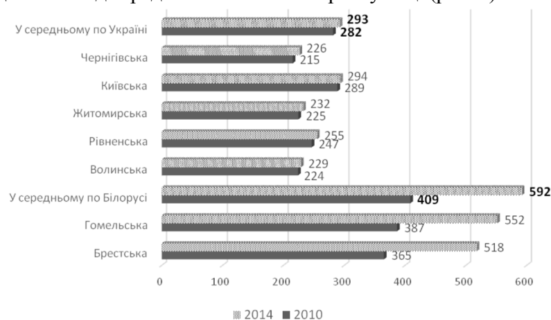
Рис. 2. Показники середньомісячної заробітної плати у прикордонних регіонах Білорусі та України, дол. США

Схожа ситуація спостерігалася і за іншими показниками, наприклад, середньомісячній заробітній платі. У 2010 р. середній показник по Україні становив 282 дол. США, тоді як у всіх розглянутих прикордонних регіонах (крім Київської області) він був нижчим мінімум на 14 % (у Рівненській області), максимум – на 31 % (у Чернігівській області). У 2014 р. це співвідношення залишилося практично незмінним. У Білорусі середньомісячна заробітна плата у 2010 р. перевищувала середній український показник на 45 % і дорівнювала 409 дол. США. У 2014 р. середньомісячна заробітна плата білоруських працівників більш ніж удвічі випереджала заробітну плату, яку отримували за місяць працівники в Україні – 293 дол. Водночас, як і в Україні, середньомісячна заробітна плата у прикордонних регіонах Білорусі відставала від середніх показників по республіці (рис. 2).