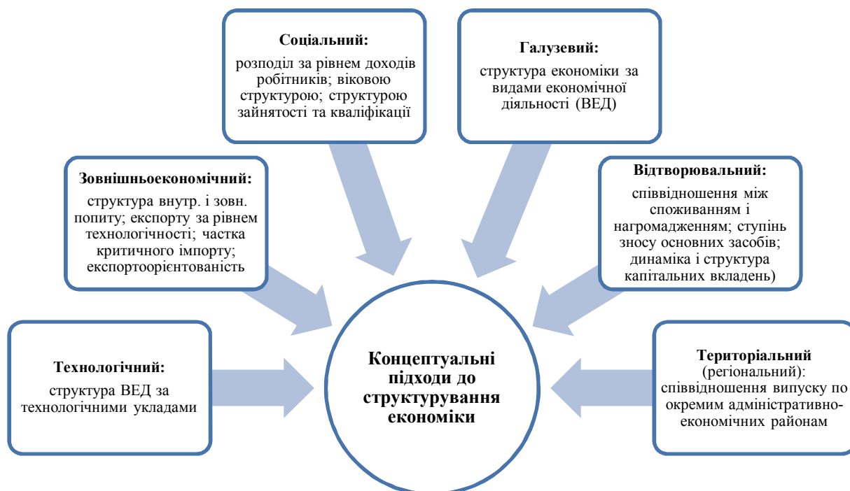
Рис. 1. Концептуальні підходи до структурування економіки

Економічна система є поліструктурним утворенням, тобто їй притаманні різноманітні структури, які характеризуються як сукупність комплексів внутрішніх зв'язків між основними її елементами (сферами, галузями, секторами, регіонами, формами власності тощо) і окремими структурними утвореннями всередині цих елементів, пов'язаних між собою системою суспільного поділу праці. Виокремлюють відтворювальну, техніко-економічну, технологічну, організаційно-економічну, соціально-економічну, галузеву й територіальну (регіональну) структури. Деталізацією цих видів структур є: зовнішньоекономічна, структура власності, структура зайнятості населення, матеріальних і фінансових ресурсів, структура енергозабезпечення тощо (рис. 1).