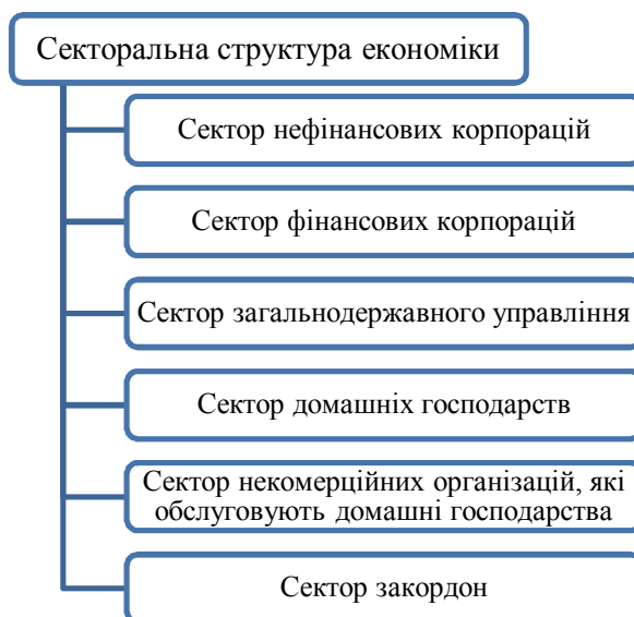
Рис. 3. Інституційні компоненти секторальної структури економіки

Структурування економіки за інституційними секторами. Інституційні сектори економіки являють собою господарські одиниці, які знаходяться в межах економіки і володіють активами, беруть на себе зобов'язання та можуть займатися господарською діяльністю з іншими господарськими одиницями (рис. 3).