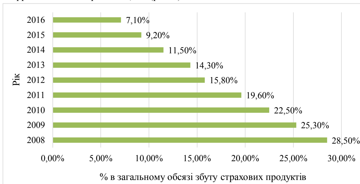
Рис. 3. Динаміка банкострахування в Україні протягом 2008–2016 років

Протягом 2008-2016 рр. в Україні у відносинах між певною кількістю банківських установ і страхових компаній у контексті банкострахування спостерігаємо стагнацію. Максимальне значення банкострахування в загальному обсязі збуту страхових продуктів в Україні сягнуло 28,5 % у 2008 році [2], у 2013 р. – 14,3 % [2] і протягом 2008–2016рр. знизилася в 4 рази до 7,1 % (рис. 3).