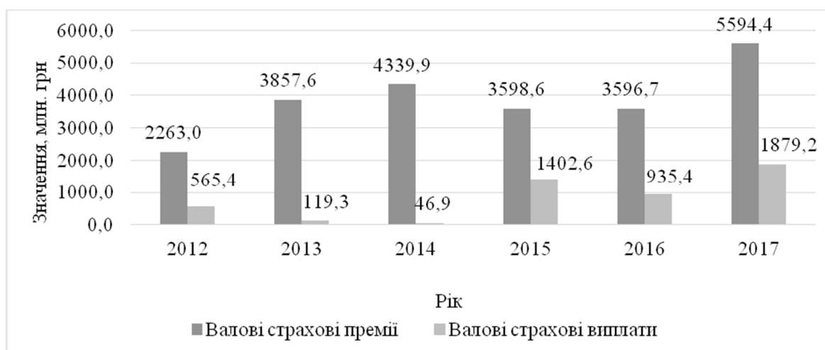
Рис. 2. Динаміка валових чистих страхових премій та виплат при страхуванні кредитів за 2012–2017 роки