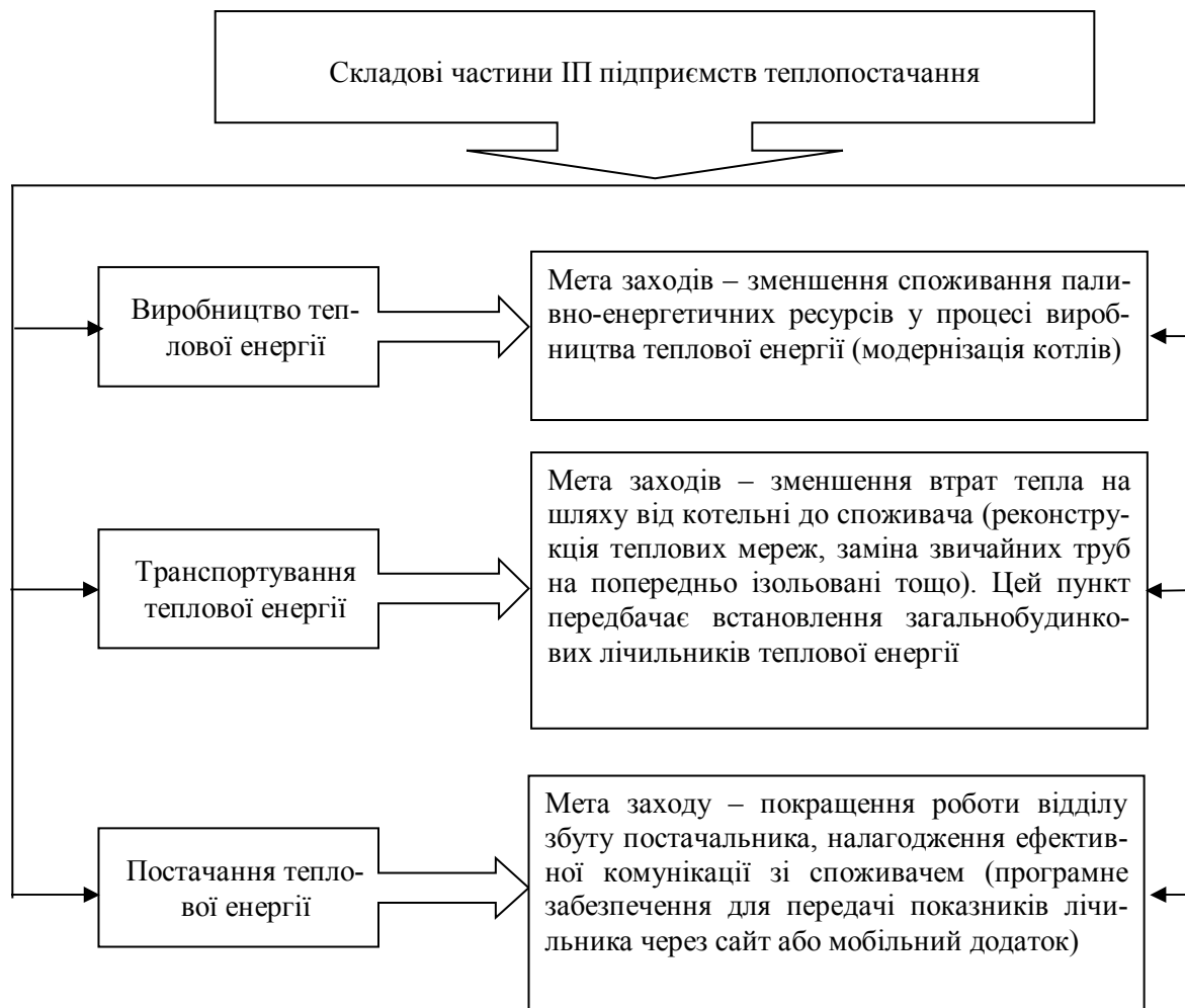
Рис. 2. Складові частини інвестиційної програми підприємств теплопостачання

Відповідно до складових частин ІІІ підприємств теплопостачання (рис. 2) та вимог чинного законодавства, останні повинні містити фінансовий план використання коштів, який визначає очікувані витрати протягом планового періоду (триває 12 місяців, на які здійснюється формування тарифів) [8; 9; 13].