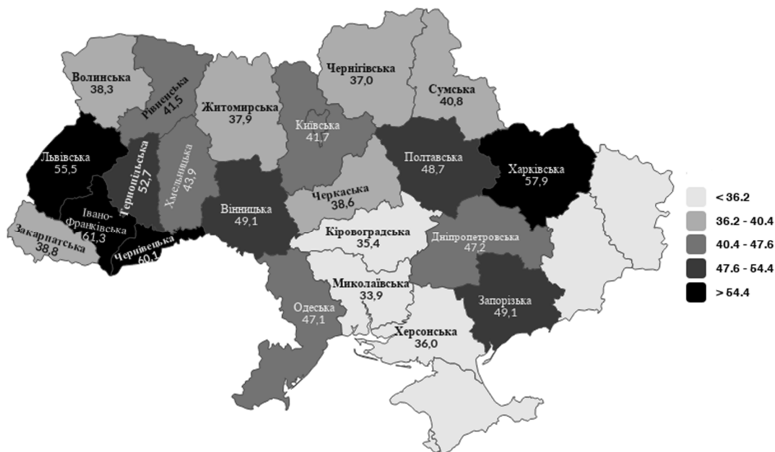
Рис. 3. Карта розподілу кількості лікарів усіх спеціальностей на 10 тис. населення за регіонами України у 2017 році