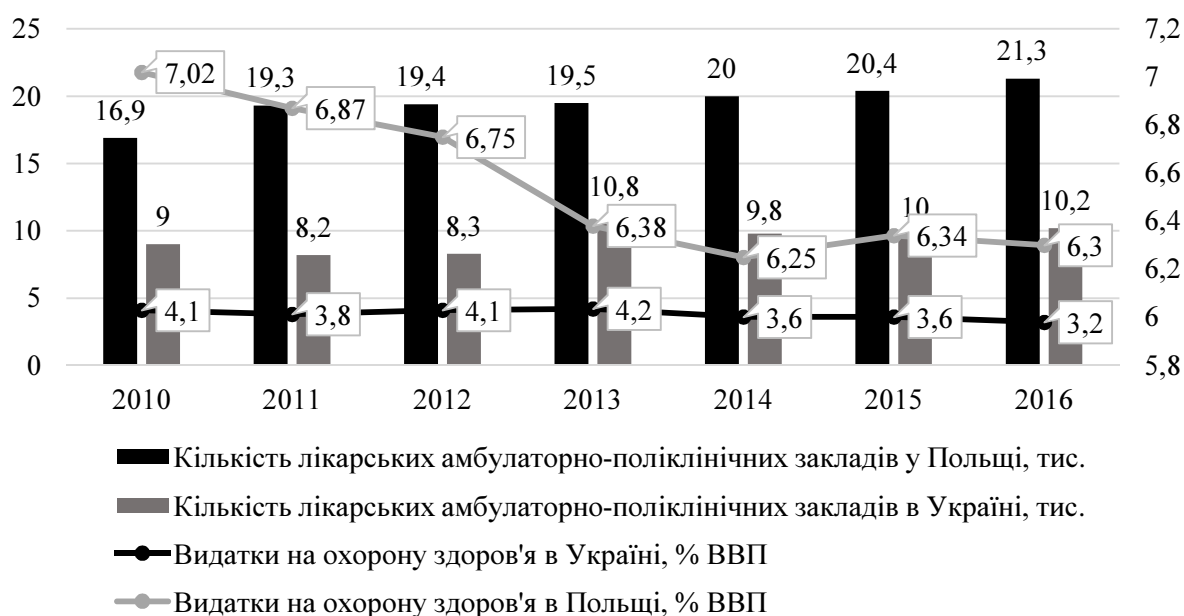
Рис. 2. Динаміка кількості лікарських амбулаторно-поліклінічних закладів та видатки на охорону здоров'я в Польщі та Україні за 2010–2016 роки