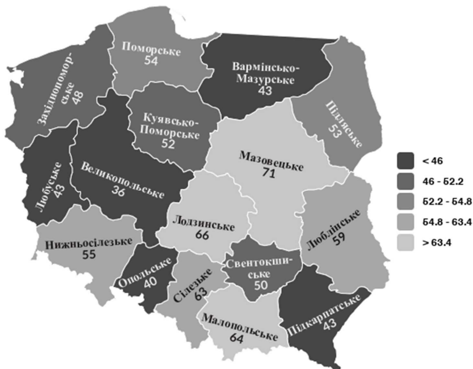
Рис. 4. Карта розподілу кількості лікарів усіх спеціальностей на 10 тис. населення Польщі в регіональному розрізі у 2017 році

Стан кадрових ресурсів системи охорони здоров'я Польщі в регіональному розрізі представлена на рис. 4. У 2017 році найменша кількість лікарів усіх спеціальностей на 10 тис. населення спостерігалась у таких воєводствах: Західнопоморському – 36 лікарів, Великопольському – 40 лікарів, Вармінсько-Мазурському – 43 лікарі, Свентокшиському – 43 лікарі та Сілезькому – 43 лікарі.