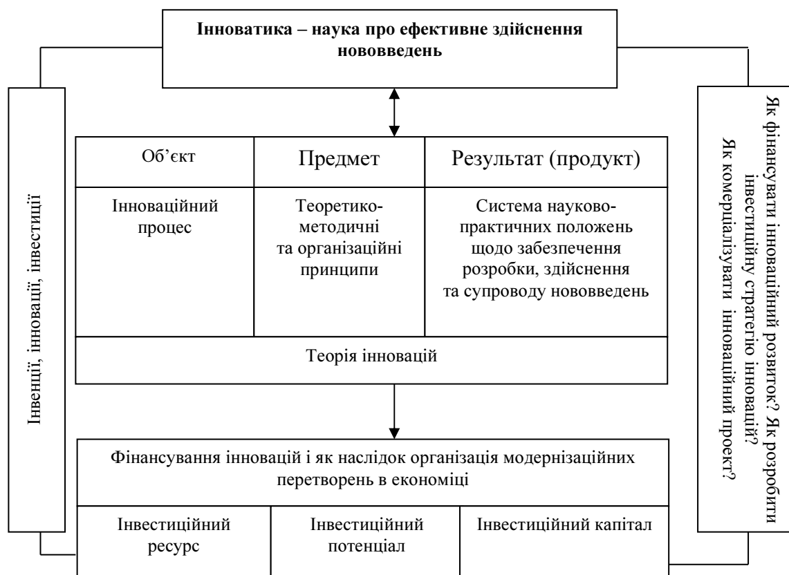
Рис. 2. Місце інвестиційного ресурсу в інновації