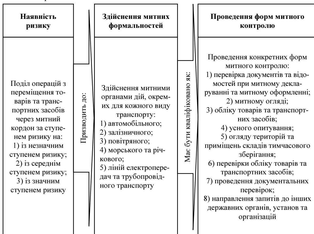
Рис. 1. Взаємозв'язок аналізу митних ризиків із митними формальностями та формами митного контролю

Вибір форм та методів митного контролю є наслідком здійснення процесу управління митними ризиками, що передбачає роботу митних органів з аналізу ризиків, виявлення та оцінки ризиків, розроблення та практичної реалізації заходів, спрямованих на мінімізацію ризиків, оцінки ефективності та контролю застосування таких заходів. Система управління митними ризиками спрямована на забезпечення вибіркової й достатності митного контролю для дотримання національних митних інтересів і безпеки держави, зокрема на основі використання засобів автоматизації процесів. Графічна модель взаємозв'язку митного контролю та системи управління митними ризиками представлена на рис. 1.