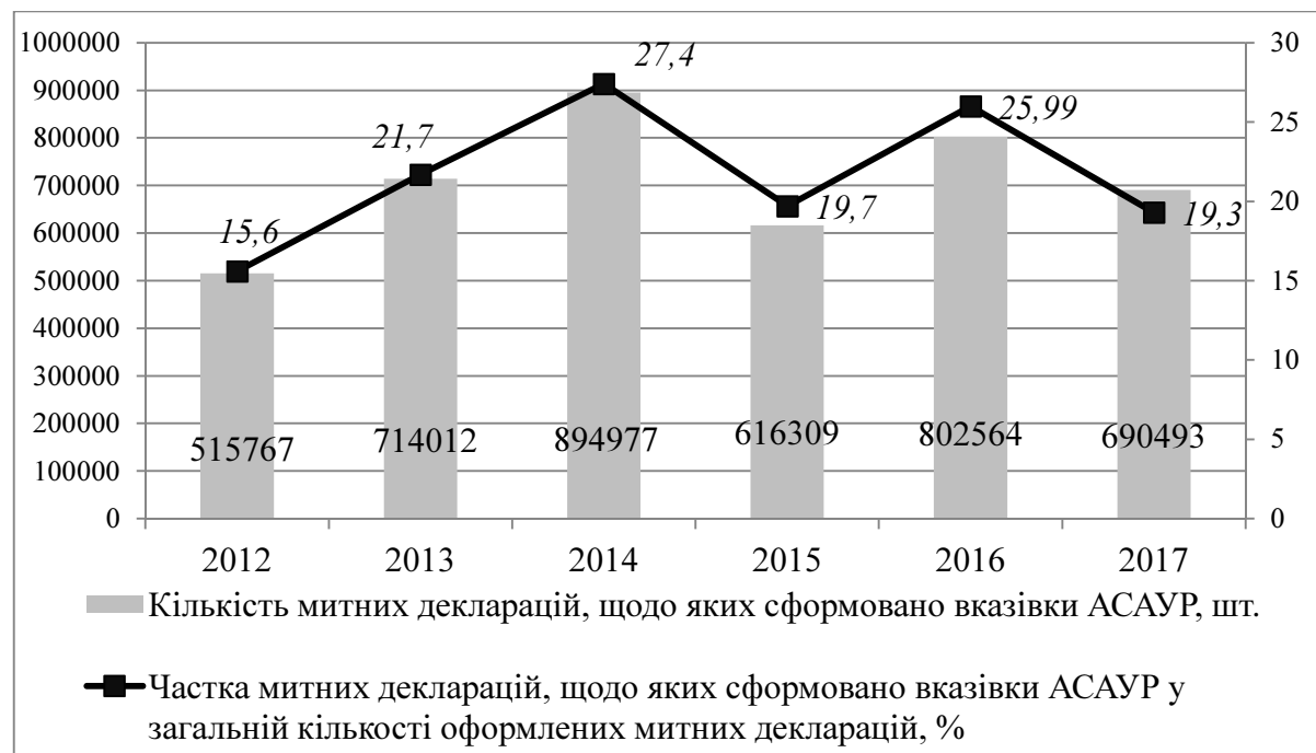
Рис. 3. Динаміка митних декларацій щодо яких сформовано вказівки АСАУР у 2012–2017 рр.