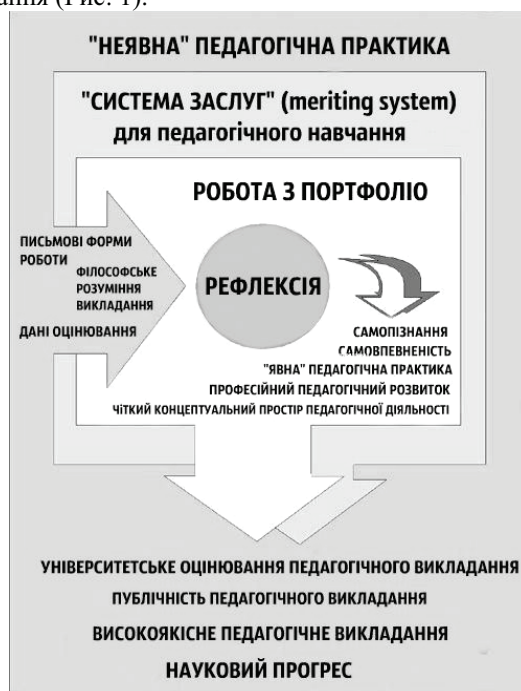
Рис. 1. «Система заслуг» (meriting system) у педагогічному навчанні.

Виклад основного матеріалу дослідження. Університет Оулу 1994 року був першим, який офіційно застосував «систему заслуг» (meriting system) для педагогічного навчання (Рис. 1).