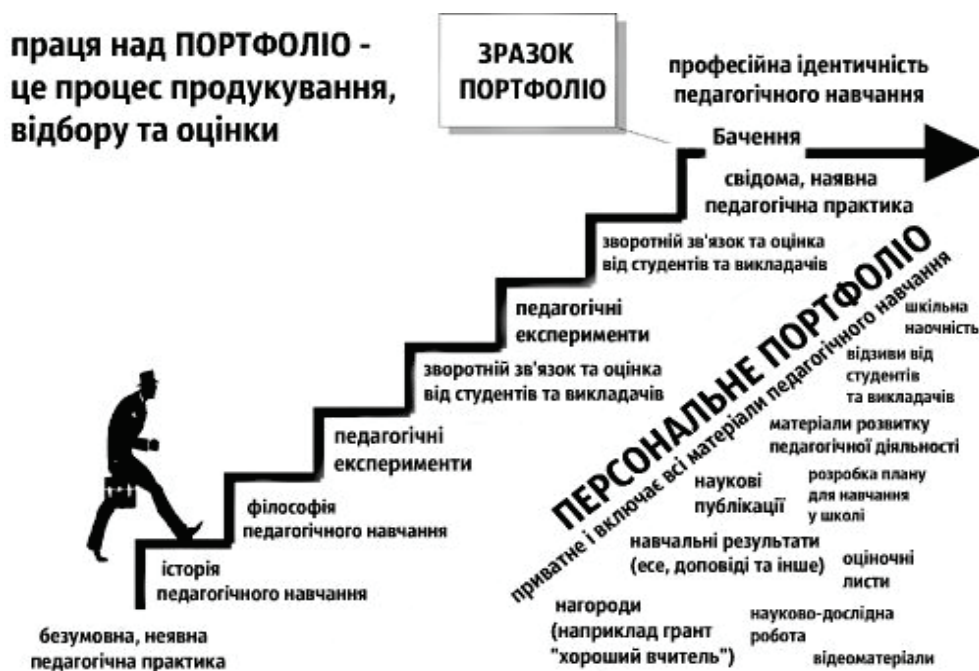
Рис. 3. Кроки для роботи з персональним портфоліо.

Досвід фінських педагогів та вчених показує, що найбільш ефективним способом у покращенні педагогічної практики є визнання і вивчення власної філософії навчання, щоб в подальшому розвивати власні теорії навчання. Крім історії навчання та філософії навчання велика увага звертається на педагогічний експеримент та оцінку від однокласників та викладачів. Така оцінка стимулює до подальшого розвитку особистих методів навчання та проходження педагогічної практики. Професійний досвід майбутнього вчителя розвивається поступово, відповідно набутого досвіду, педагогічної підготовки та наукових експериментів. Кожен учитель повинен знайти свій власний стиль якісного педагогічного викладання у школі [7, с. 58].