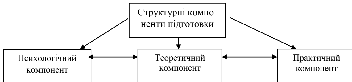
Схема 1. Структурні компоненти підготовки щодо формування готовності викладача до створення емоційно сприятливого середовища у студентському колективі

цінності, сприятливий клімат студентського колективу, психологічний комфорт кожного його члена.