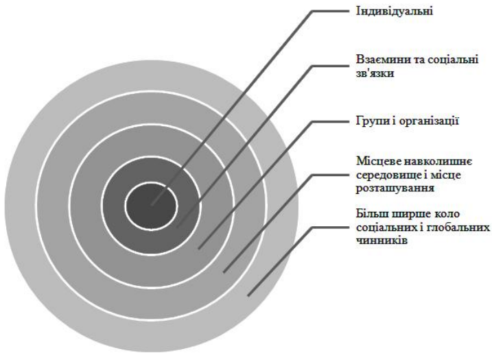
Рис. 3. Чинники, що формують участь

За умови більш глибокого погляду на психологічну складову формування громадської участі можна зауважити, що громадська участь людини обумовлюється глибинними особистісними структурами, які становлять мотиваційно-ціннісну сферу її особистості. У цій сфері поєднуються такі складові, як інтереси, мотиви, потреби, настановлення, пере-