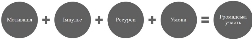
Рис. 2. Формула громадської участі