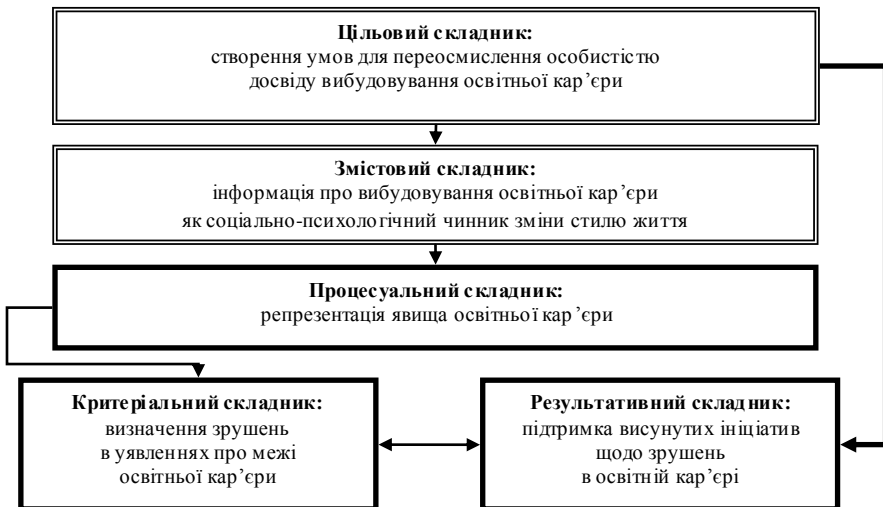
Рис. 2. Складники формування досвіду вибудовування освітньої кар'єри

Але механізм впливу на чинник вибудовування освітньої кар'єри однаковий – через формування досвіду вибудовування освітньої кар'єри, відхід особистості від неосмисленого повсякдення, якому надаються характеристики органічної неподільності. Цільовий, змістовий, процесуальний, критеріальний і результативний складники формування досвіду вибудовування освітньої кар'єри представлено на рис. 2.