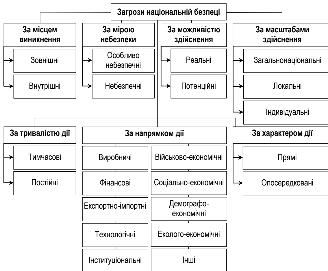
Рисунок 1 – Класифікація загроз національній економічній безпеці [10]

На сьогодні основними загрозами національній безпеці в економічній сфері є: