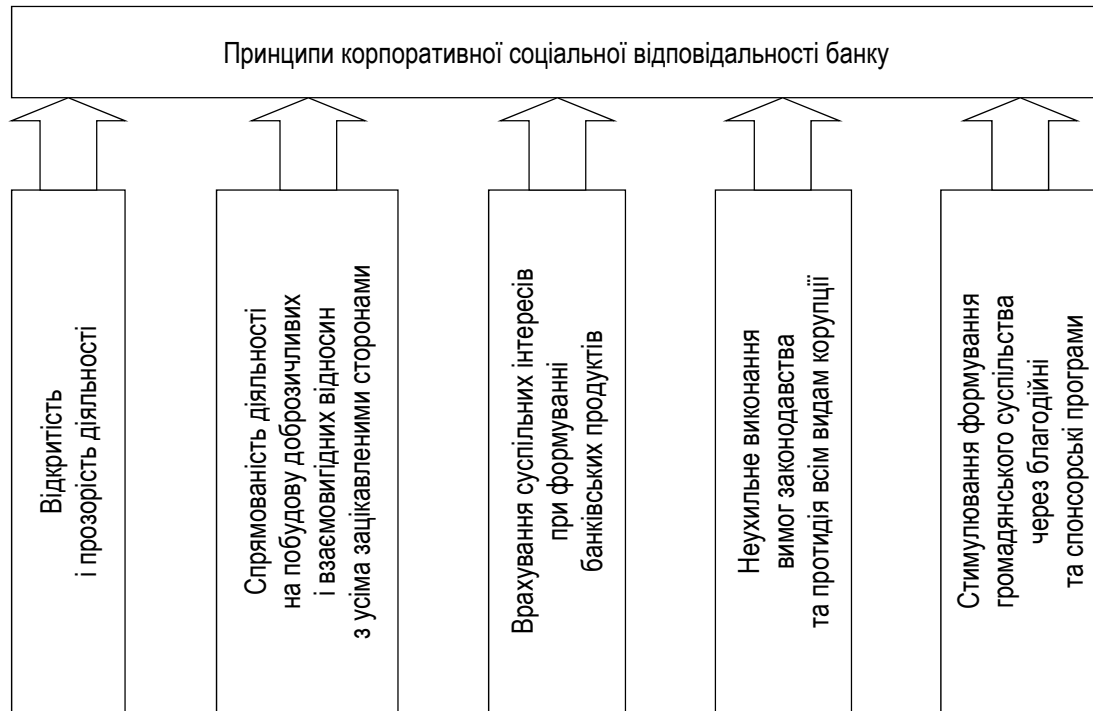
Рисунок 1 – Принципи корпоративної соціальної відповідальності банку

Розкриємо сутність визначених нами принципів.