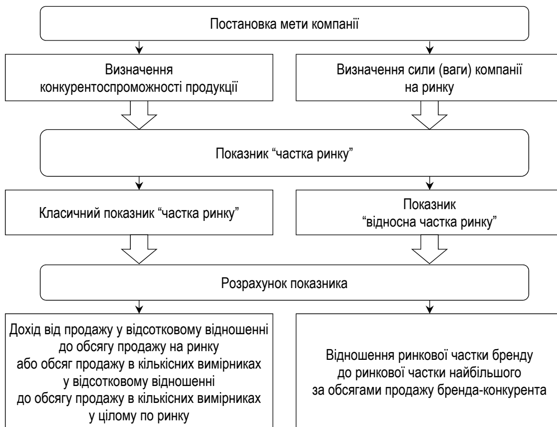
Рисунок 2 – Залежність розрахунку показника частки ринку від поставленої мети компанії

Наступним критерієм ефективності маркетингової діяльності є частка ринку, що є головною в моделі побудови японського бізнесу. Залежно від поставленої мети компанії змінюється розрахунок цього показника (рис. 2).