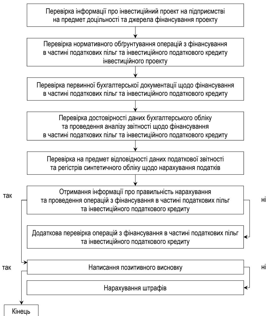
Рисунок 2 – Алгоритм проведення податкового контролю на підприємствах у СЕЗ з фінансування в частині податкових пільг та інвестиційного податкового кредиту