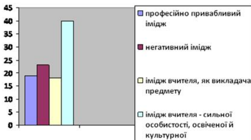
Рис. 1. Співвідношення різних типів іміджу професії вчителя сформованих у груповій свідомості сучасних школярів

Співвідношення різних типів іміджу професії вчителя, сформованих у груповій свідомості школярів, представлено на рис. 1.