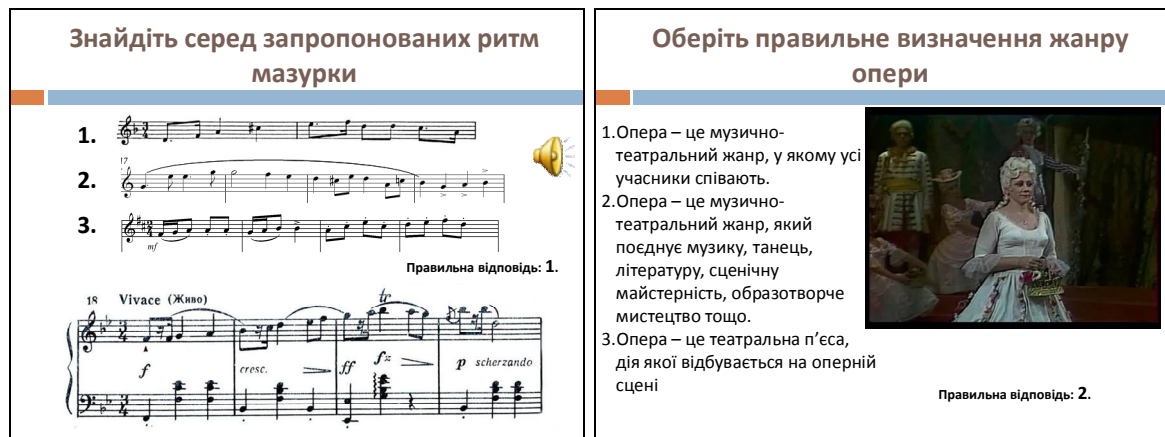
Рис. 3. Приклади тестів, створених у програмі PowerPoint

Наведені тестові програми були використані в курсі «Основ сценічно-творчого мистецтва» для оцінювання музичних знань студентів напряму 6.010102 – «Початкова освіта», факультету ПВПК – майбутніх учителів початкових класів. Завважимо, що про розробці тестів були враховані вимоги до музичних знань студентів, сформульовані у програмі курсу, а також наукове розуміння музичних знань як ключових (що надають уявлення щодо соціальної ролі музичного мистецтва, емоційно-естетичної культури, враховують розвиненість музично-естетичних потреб та інтересів) та специфікованих (знання нотної грамоти, засобів музичної виразності, музично-історичні знання тощо)