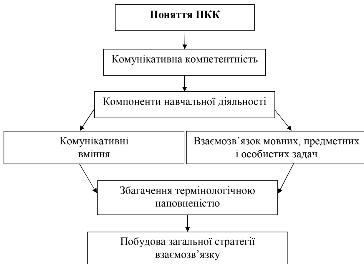
Рис. 1. Комунікативна компетентність у контексті успішної навчальної діяльності у майбутніх учителів іноземних мов і студентів-перекладачів

Багато дослідників уявляють комунікативну компетентність у вигляді взаємодіючих і взаємнопроникаючих утворень, які в післявузівській діяльності проявляються як педагогічна «майстерність». На думку В. Горяніної, однією з ознак сформованості професійної майстерності є індивідуальний стиль діяльності [4]. Формування індивідуального стилю педагогічної діяльності можливе лише на засадах оволодіння професійними знаннями, уміннями і навиками, щоб мати можливість обрати з них ті, які оптимально співпадають з індивідуальними здібностями особистості.