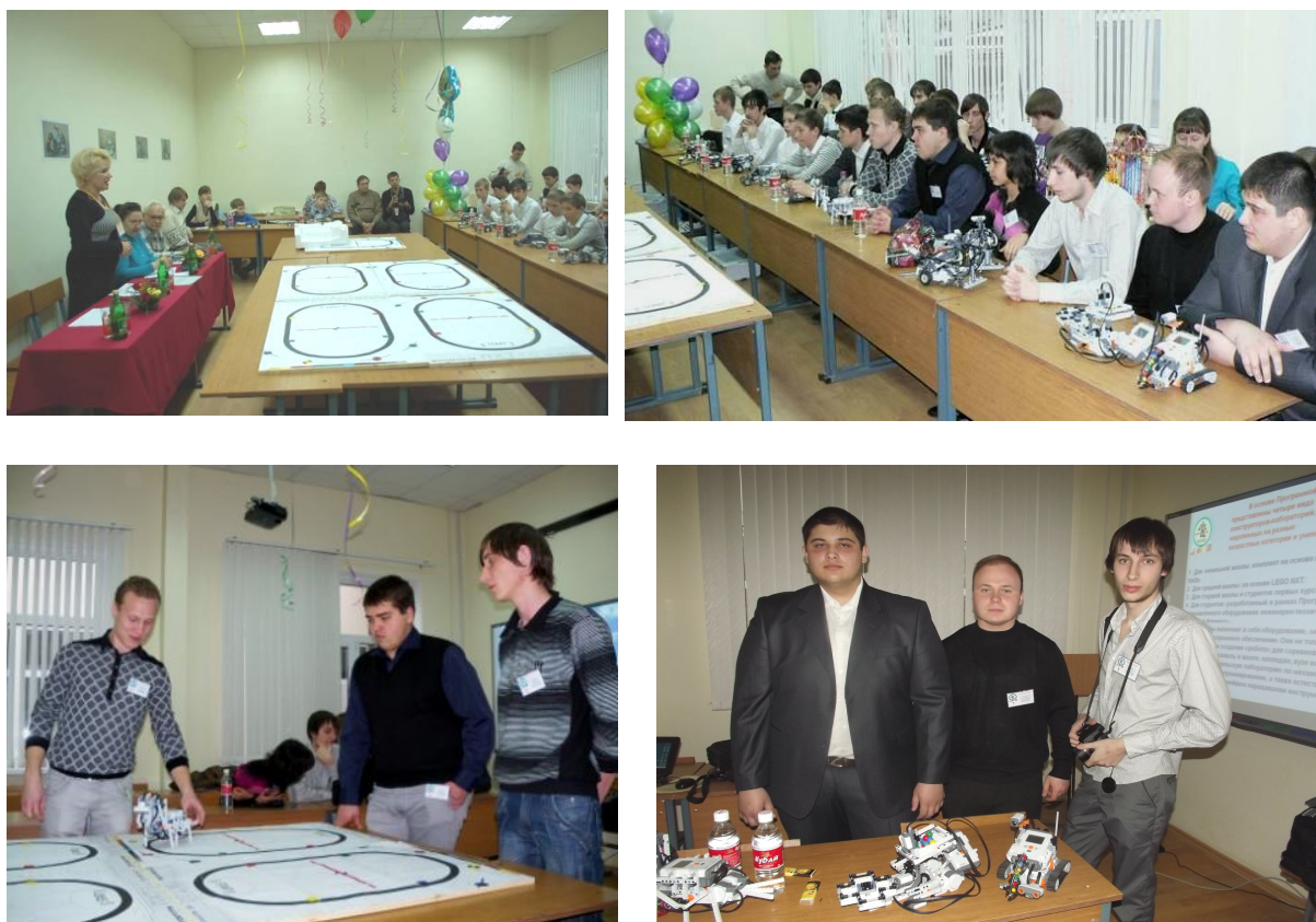
Рис. 2. Участие студентов АГПА во 3-м зональном конкурсе-фестивале научно-технического творчества детей и молодёжи по мехатронике и робототехнике «Создай свою мечту!»

На рисунке 2 показаны победители 3-го зонального конкурса-фестиваля науко-технического творчествa детей и молодёжи по механотронике и робототехнике «Создай свою мечту!» – студенты факультета технологии, экономики и дизайна Армавирской государственной педагогической академии.