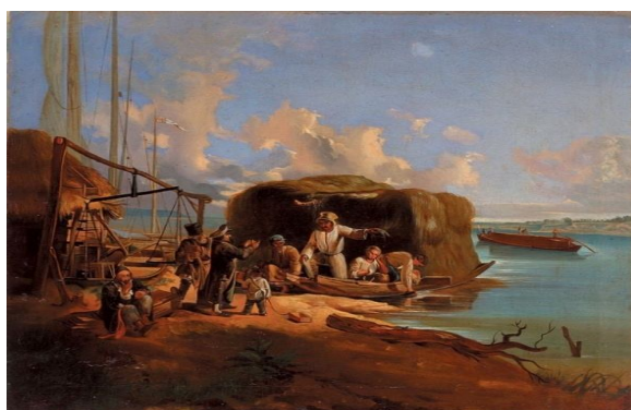
Іван Максимович Сошенко

Важливою умовою інтегративного використання мистецтва є максимальне включення студентів у активну діяльність, в якій комплексно задіяні всі органи чуття при сприйнятті й переробці інформації, а також два види досвіду: інтуїтивний і логічний. Логічний досвід проявляється в усвідомленому застосуванні студентами вже наявних у них знань у знайомих ситуаціях, інтуїтивний – у творчому пошуку, який ми їм пропонуємо через різноманітні завдання [5, с. 158]. В наш час викладачі будь-яких дисциплін мають володіти комп'ютерними технологіями, ввійти в соціальні мережі, знайти необхідний для заняття матеріал. Використовуючи, наприклад, мистецькі твори І. Сошенка і М. Мурашко можна використати завдання як при вивченні гуманітарних, так і фізико-математичних дисциплін.