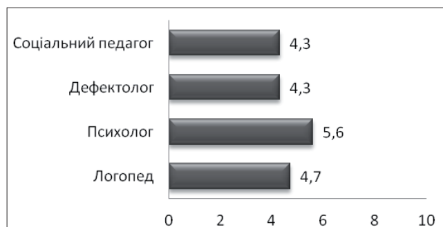
Рис. 3. Узагальнені результати вибору конкретних професій старшокласниками

Аналіз можливості вибору конкретних професій за десятибальною шкалою виявив наступні результати, що представлені на діаграмі (див. Рис. 3).