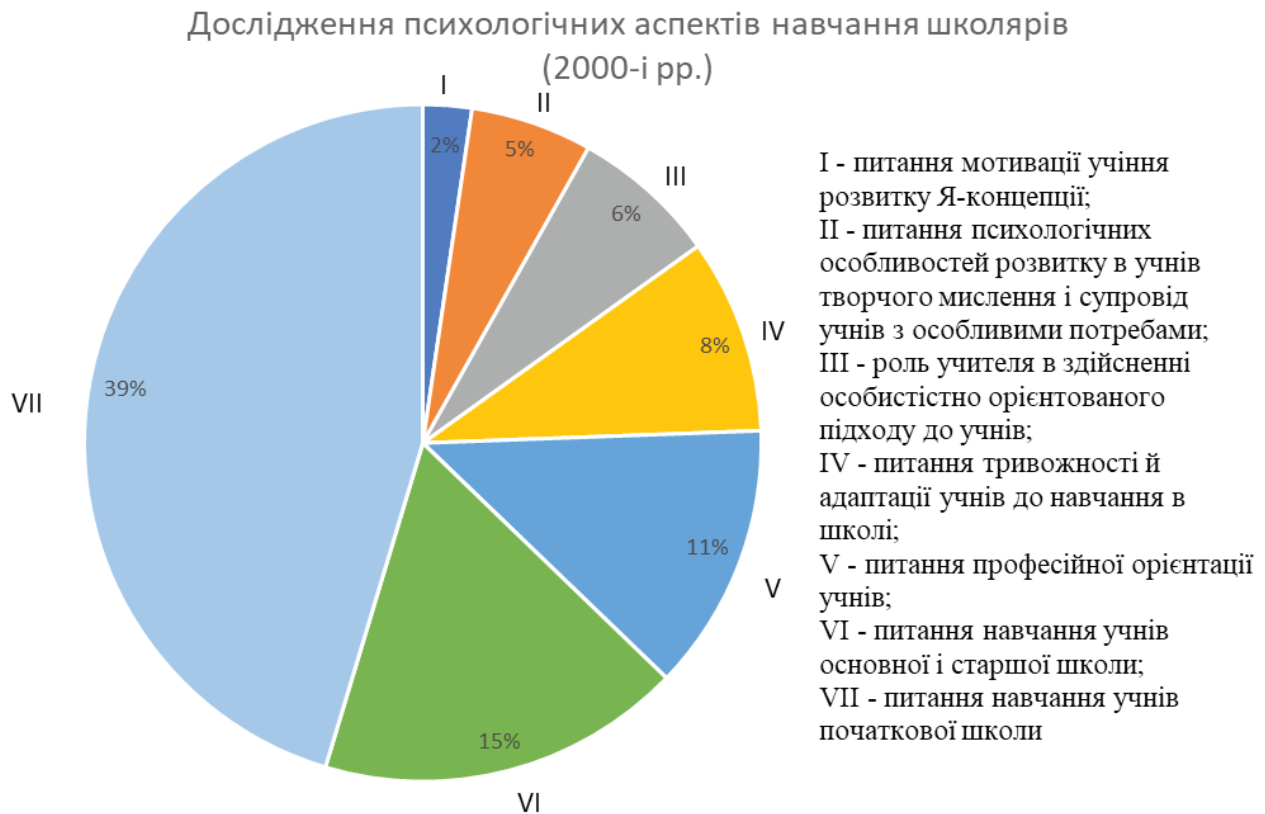
Рис. 1. Дослідження психологічних аспектів навчання школярів (2000-і рр.).

витку школярів, мотивації учіння, психічних особливостей особистісного розвитку учнів, схильних до девіантної поведінки, розвитку у школярів Я-концепції. Поодинокими студіями засвідчене вивчення питань обдарованості дітей різного шкільного віку, індивідуальних відмінностей учнів в умовах профільного навчання. Інфографіку результатів аналізу дисертаційних досліджень представлено на рис. 1 і рис. 2.