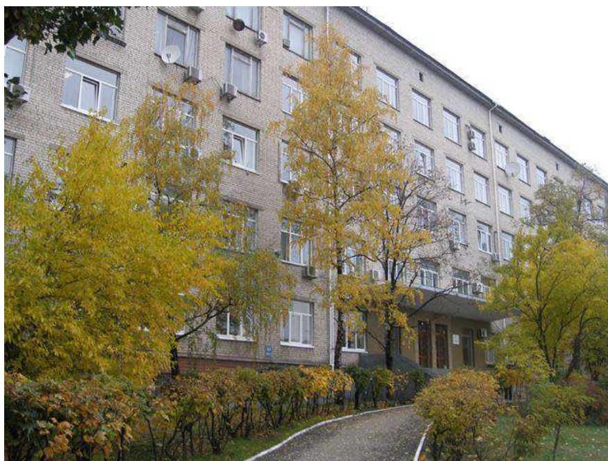
Головний корпус Інституту продовольчих ресурсів НААН

Інститут продовольчих ресурсів НААН виконує функції секретаріату Технічних комітетів стандартизації ТК 56 «Цукор і крохмале-патокові продукти» та ТК 140 «Молоко, м'ясо та продукти їх переробки», які успішно здійснюють передбачені Національною