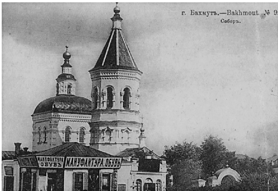
Троїцький собор поч. XX ст.