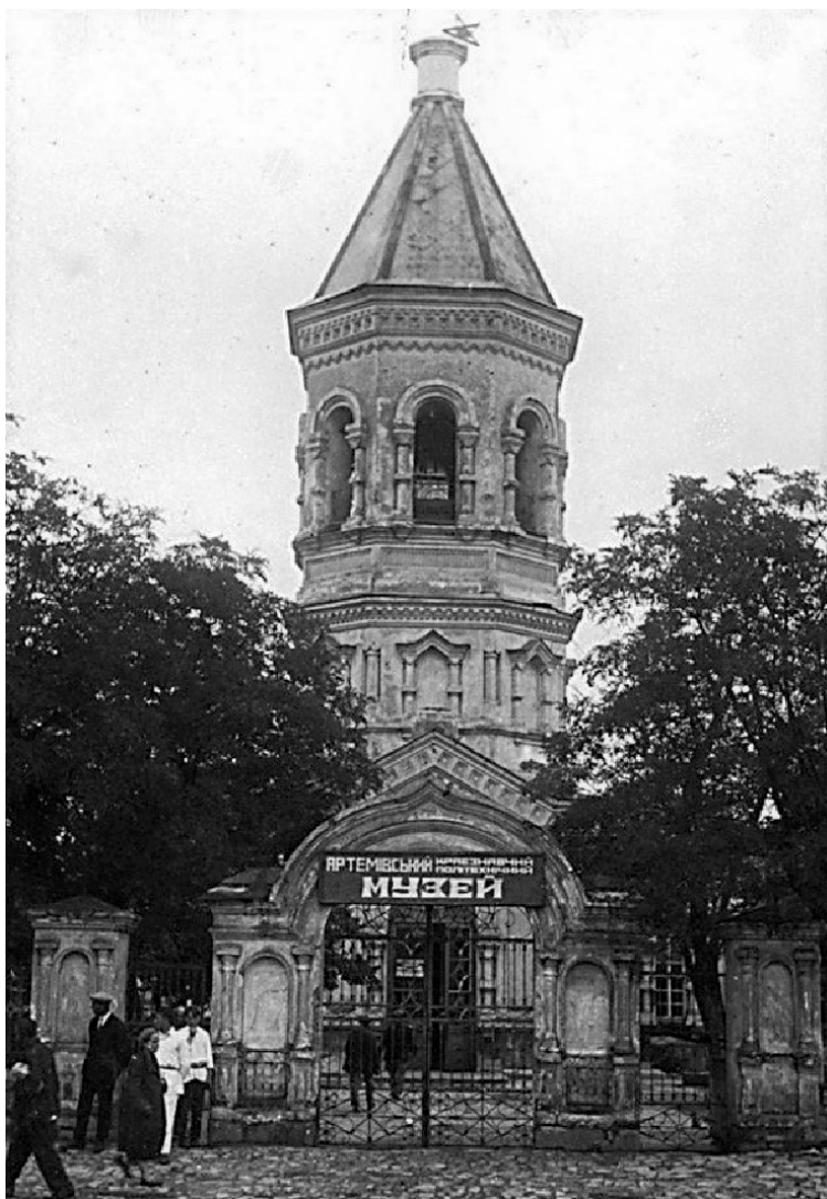
Будівля собору поч. 1930-их рр.