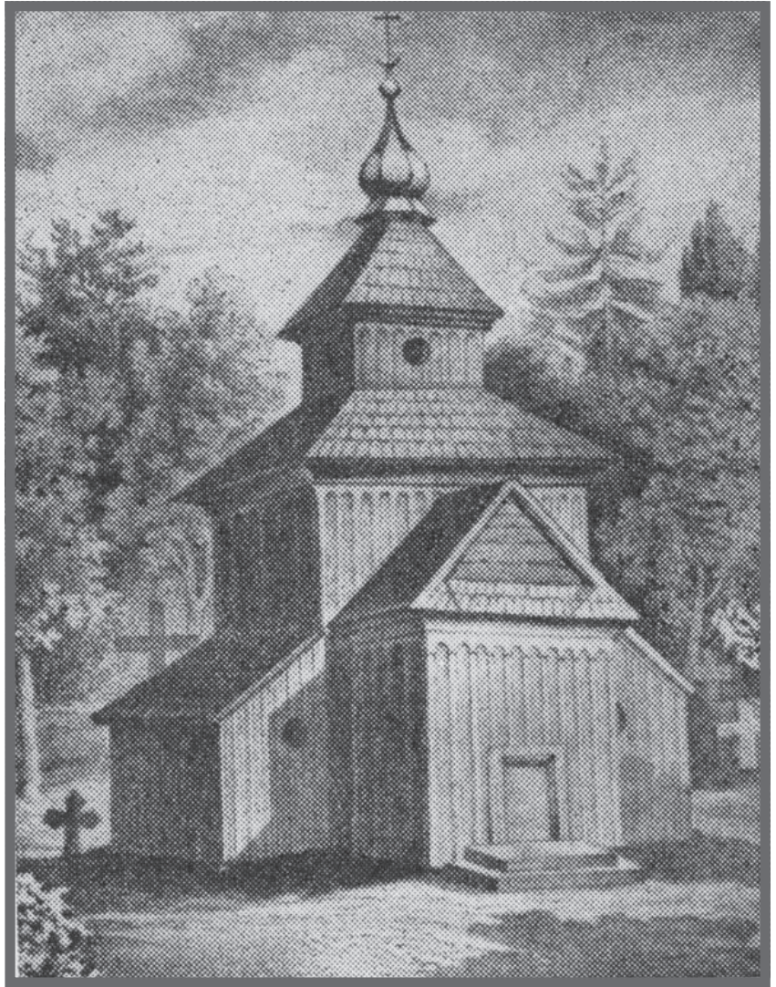
Церква Св. Трійці з малюнка Тараса Шевченка

Припускаю, що ця чаша дісталась нинішній вербківській церкві від колишнього монастиря, думаю, що православні жили тут в XI ст.» [8, с. 140]. Маємо зауважити, що цензор статті о. Федота Кудринського перекреслив цю дату таким тлумаченням: «Справедливість такої думки – гіпотетична. Напис року на чаші наводить сумнів, мішаника (смісь) цифр римських з церковнослов'янськими дає дуже малу основу такому висновку» [8]. У твердженні цензора, безперечно, відчутні типові інструкції синоду білої московської імперії зла: занижувати вік українським містам, селам, монастирям, храмам, першодрукам і т. д. Бо ж появляться дати істинні, то перекреслиться і роль Москви у «несенні віри і культури» іногородцям, малоросам. Як же міг цензор не засумніватись у даті, зазначеній на чаші?! У Вербці на острівку був 1041 р. монастир-