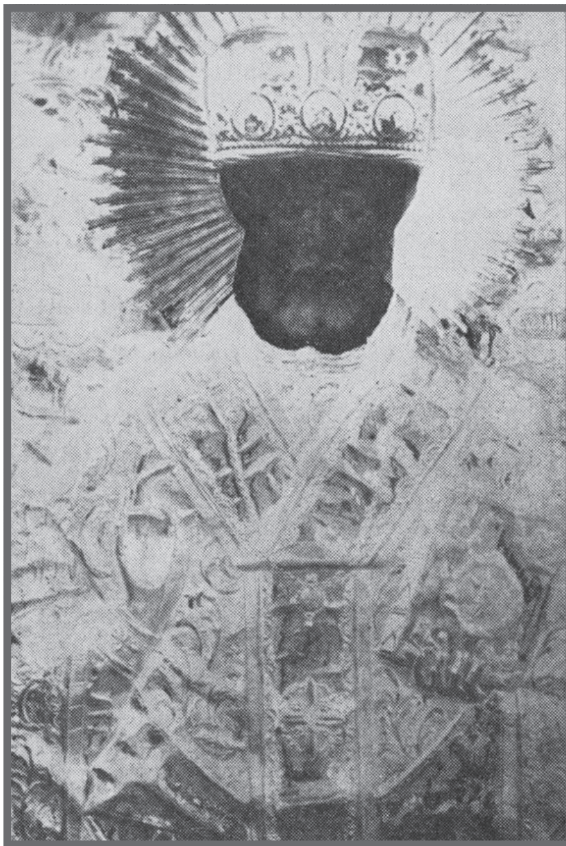
Чудотворний образ св. Миколая

Причин занепаду монастиря Св. Трійці біля с. Вербка, на нашу думку, є кілька. Відкидаємо як нічим не підкріплену гіпотезу дослідників XIX ст. про те, що монастир спалили татари. Давній, цілком можливо, але не доби князів Сангушків, Курбського. Чому? Бо ж від