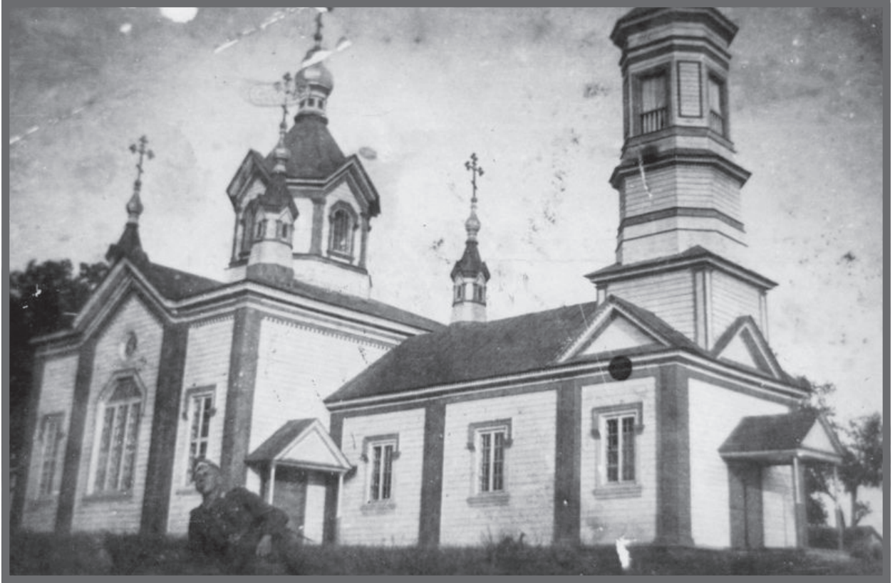
Церква Св. Трійці, 1901 р.

осоку, очерет, різні трави. Залишаємо авто і по знайомому містку переходимо через Турію, береги якої поросли верболозами. Перед нашими очима монастирище, на якому раніше стояв дерев'яний хрест-фігура з металевою огорожею на місці вівтаря згорілого храму. Нині вже новий хрест і на новому місці. Острівець з монастирищем нагадує великий безладно розкиданий мурашник. Ми – ніби на будівельному майданчику: скрізь повно щебеню, піску, сміття, розбита важкими вантажними автомашинами земля, невелика дерев'яна церква і будинки невідомого призначення... Виявляється, монастирище на острівку опанували московські батюшки, і хоч вони в тодішню неділю були відсутні (у с. Вербка вони з колишнього клубу зробили церкву?!), але сліди їх «наполегливої, далеко не церковної праці» відчувались скрізь: розклад богослужб, прейскуранти треб в московській мові на стіні церкви, інші оголошення на «том же язике». Ми всі дивуємось відсутністю на рідній землі рідної мови в незалежній Україні?! Звертаю на це увагу п. радника, але він лише розводить руками. Допоки мої кияни знімають на плівку новоявлені будівлі,