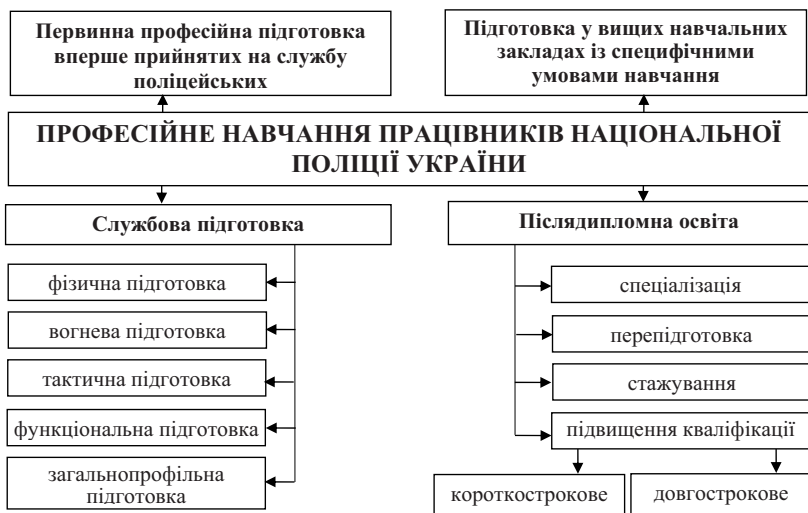
Рис. 1. Складові професійного навчання працівників Національної поліції України

оновлювати і накопичувати. Формування готовності працівників до професійної діяльності відбувається під час професійного навчання, що забезпечує розширення набутих знань, удосконалення сформованих умінь та навичок у процесі спеціалізованої підготовки. Відповідно до статті 72 закону України «Про Національну поліцію» [9] система професійного навчання поліцейських складається з первинної професійної підготовки; підготовки у вищих навчальних закладах із специфічними умовами навчання; післядипломної освіти; службової підготовки. Схематично складові системи професійного навчання зображено на рисунку 1.