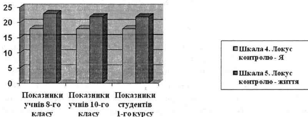
Рис. 2. Середні значення показників шкал «Локус контролю - Я», «Локус контролю - життя»

«Локус контролю - життя» домінує у всіх вікових категоріях досліджуваних (рис. 3), що свідчить про впевненість у собі, у можливості керування власним життям, вільно приймати рішення та втілювати їх у життя. «Локус контролю - Я» знаходиться на середньому рівні розвитку, що вказує на впевненість опитуваних у собі як особистості, яка здатна самостійно побудувати своє життя у відповідності із власними цілями та принципами.