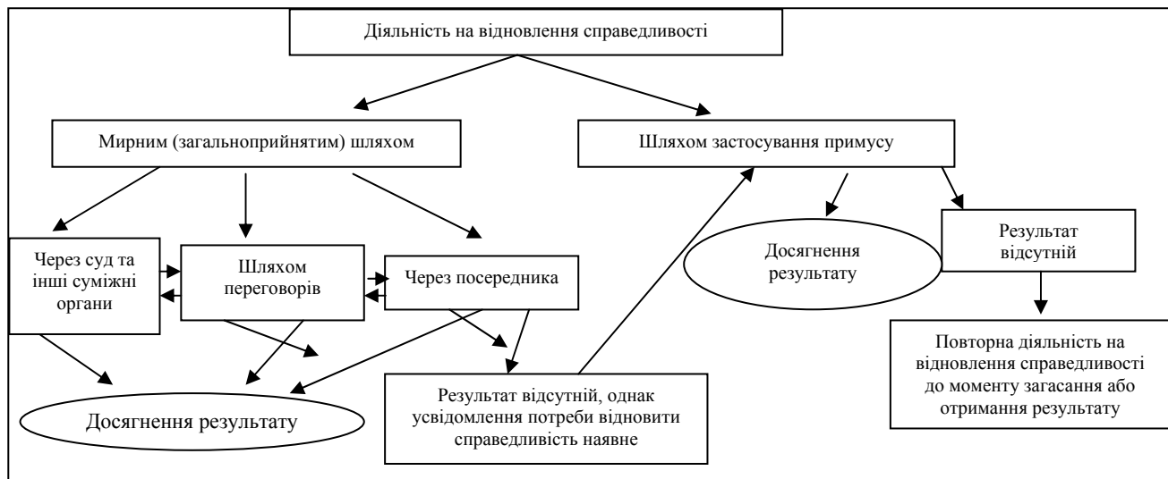
Рис. 2 Шляхи відновлення справедливості

Україні в цивільному, господарському та адміністративному процесах є актуальним, доцільним та, з огляду на досвід розвинених країн, може бути достатньо ефективним [2, с. 47-49].