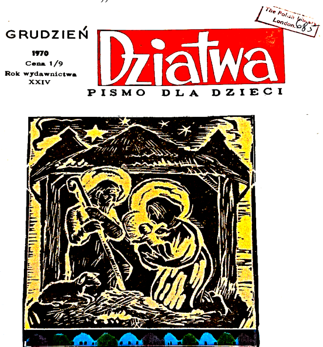
Fot.1. Czasopismo dla dzieci „Dziatwa”

Źródło: Ze zbiorów Polskiej Biblioteki POSK w Londynie.