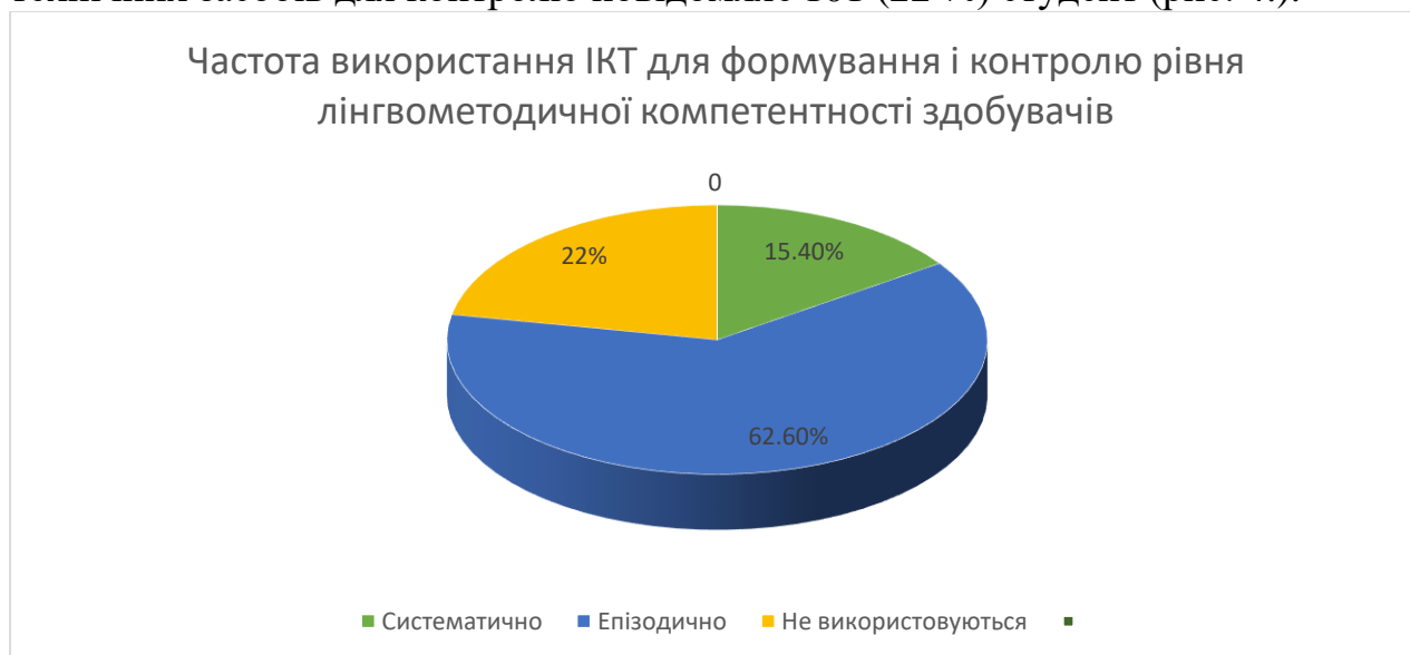
Рис. 4. Результати опитування щодо частоти використання ІКТ для формування і контролю лінгвометодичної компетентності

технічних засобів для контролю повідомляє 101 (22 %) студент (рис. 4.).