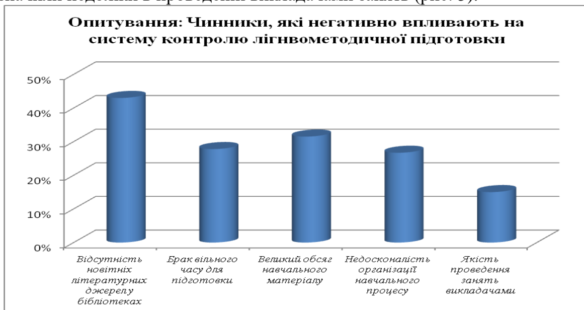
Рис. 5. Результати опитування щодо чинників, які негативно впливають на контроль лінгвометодичної компетентності

Спроба визначати чинники, які, на думку студентів, негативно впливають на систему контролю під час лінгвометодичної підготовки на факультеті, завершилася таким розподілом відповідей: відсутність новітніх літературних джерел у бібліотеках відзначили 198 (43,0 %) осіб, брак вільного часу для більш ґрунтовної підготовки до занять – 128 (27,8 %), надто великий обсяг навчального матеріалу – 145 (31,5 %) респондентів. Зауважимо, що 120 (26,7 %) студентів наголосили на недосконалоості організації навчального процесу, а 69 (15,0 %) відзначили недоліки в проведенні викладачами занять (рис. 5).