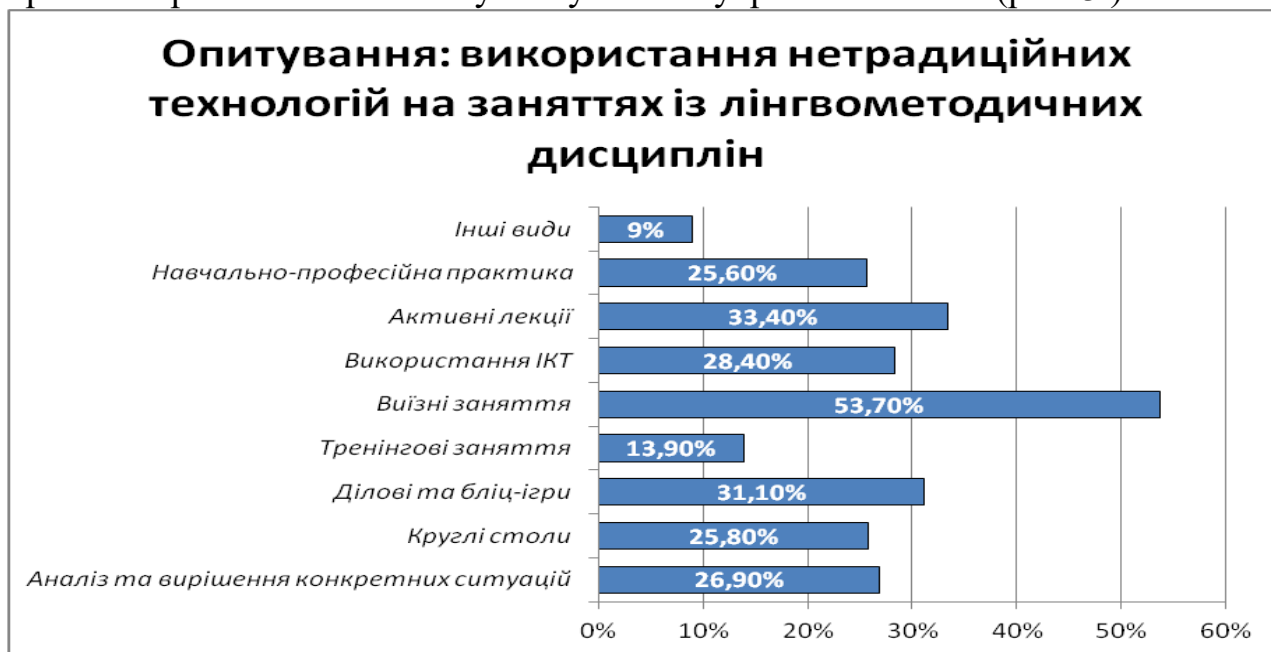
Рис. 3. Результати опитування щодо використання нетрадиційних технологій на заняттях із лінгвометодичних дисциплін

Наступне питання анкети було таким: «Чи хотіли би Ви, щоб система діагностування рівня Ваших компетентностей на заняттях із лінгвометодичних дисциплін включала в себе використання нетрадиційних технологій? Яких саме?». Відповіді майбутніх учителів української мови розподілились так: аналіз і вирішення конкретних ситуацій відзначили 124 (26,9 %) особи; круглі столи – 119 (25,8 %); ділові і бліц-ігри – 143 (31,1 %), тренінгові заняття – 78 (13,9 %); виїзні заняття відзначили 247 (53,7 %) осіб, заняття з використанням інформаційних технологій – 131 (28,4 %), активні лекції – 154 (33,4 %), навчально-професійну практику – 118 (25,6 %). Інші види контрольних заходів обрали менше 10 % респондентів, що говорить про активну позицію і практикоорієнтованість майбутніх учителів української мови (рис. 3.).