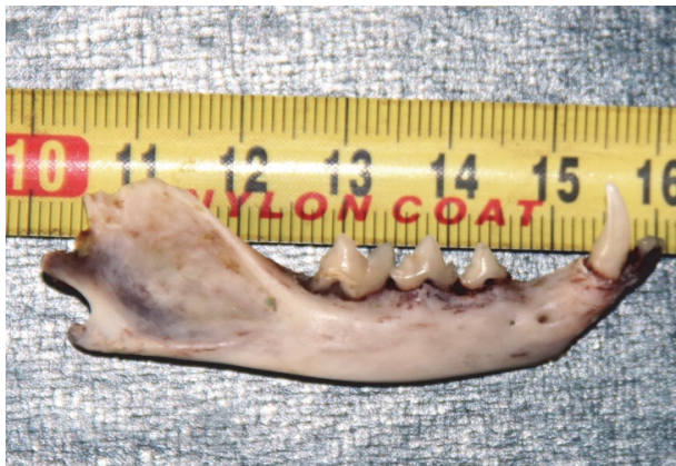
Рис. 2. Нижня права щелепа Felis silvestris , знайденого 10.10.2014 р. Fig. 2. The right mandible of Felis silvestris found on 10.10.2014.