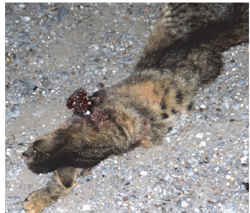
Рис. 3. Фрагмент тіла Felis silvestris , знайденого 10.10.2014 р. Fig. 3. A fragment of the body of Felis silvestris found on 10.10.2014.

З фрагментів черепа найбільш уцілілою виявилась права нижня щелепа (рис. 2). Довжина зубного ряду (від шийки першого різця до шийки останнього корінного зуба) — 34 мм.