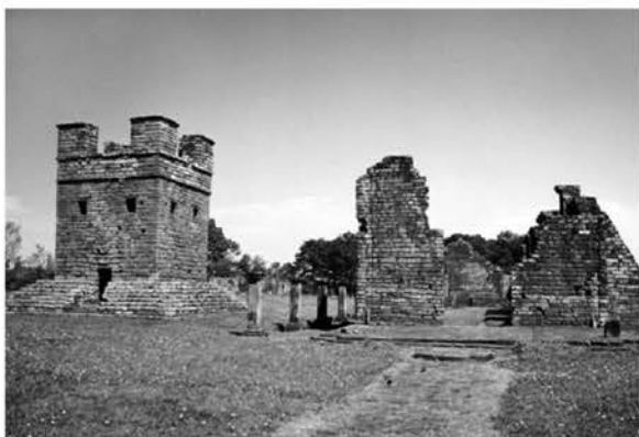
Рис. 9. Миссия Тринидад (Парагвай). Смотровая башня-колокольня