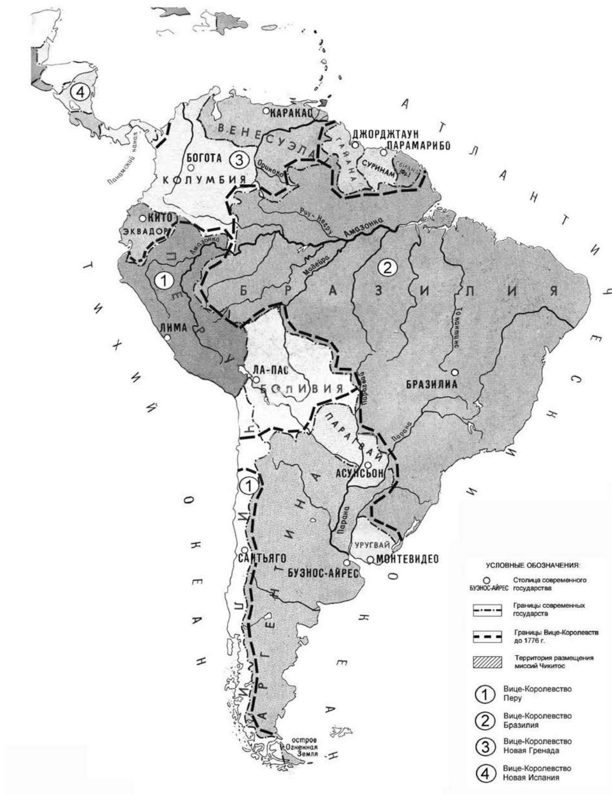
Рис. 1. Карта размещения миссий в Южной Америке в колониальную эпоху