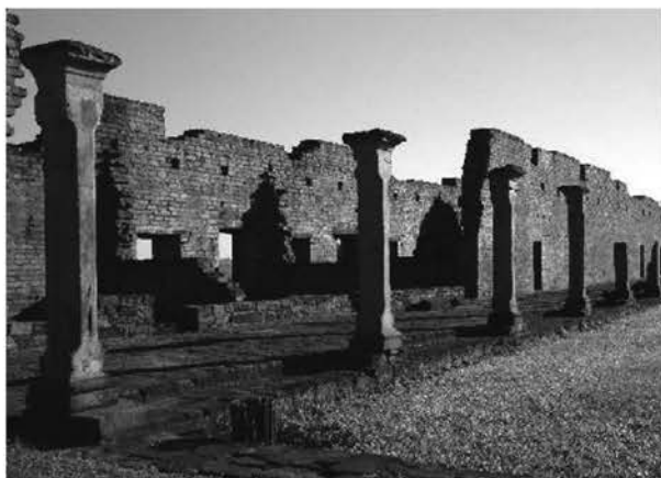
Рис. 7. Миссия Хесус (Парагвай). Колоннада галереи