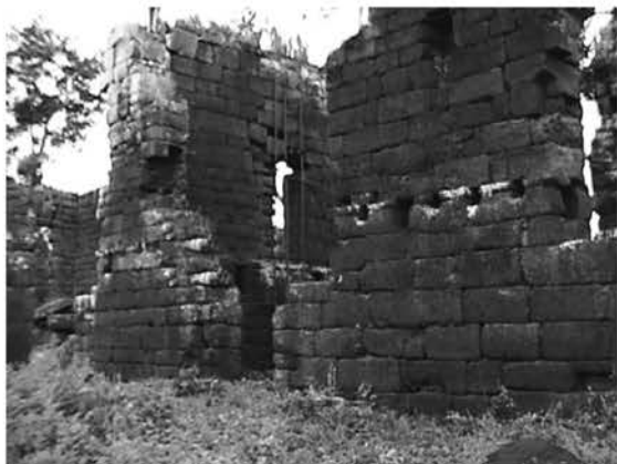
Рис. 3. Миссия Канделария (Аргентина). Стена храма