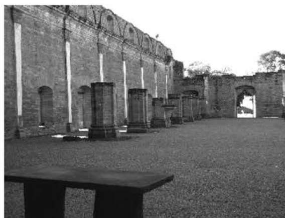
Рис. 8. Миссия Хесус (Парагвай). Интерьер главного храма