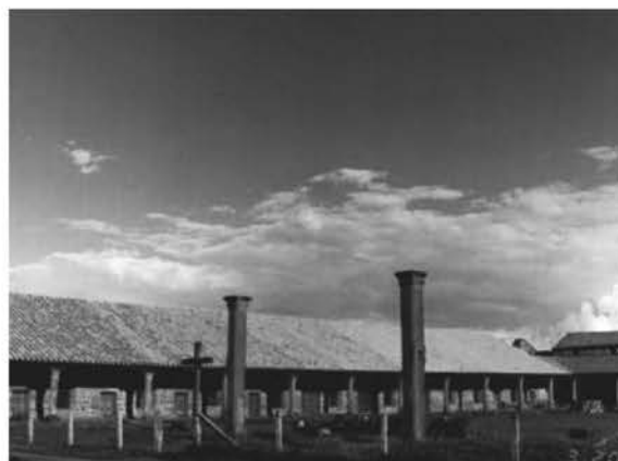
Рис. 6. Миссия Сан Космэ и Дамиан (Парагвай). Фрагмент колоннады