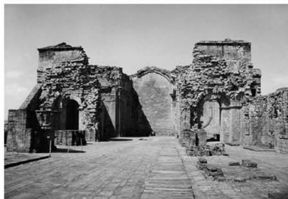
Рис. 10. Миссия Тринидад (Парагвай). Интерьер церкви