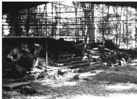
Рис. 4. Миссия Лорето (Аргентина). Ступени перед входом в церковь