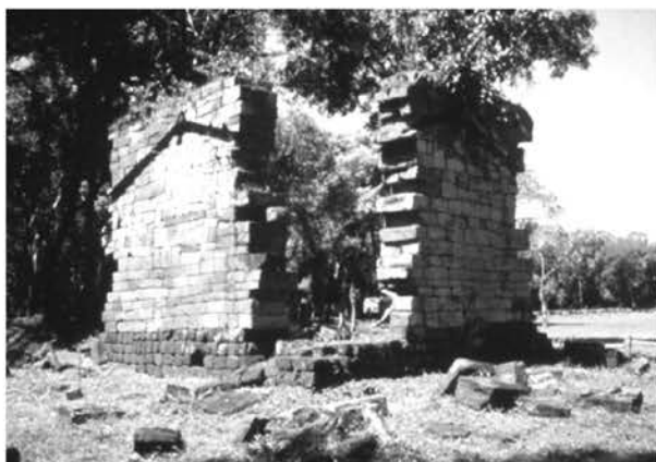
Рис. 5. Миссия Санта Анна (Аргентина). Фасад главного храма