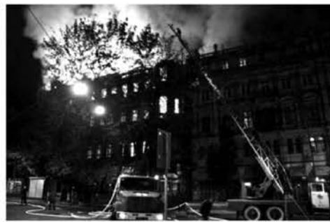
Рис.10 . Дом Руссова во время пожара 29.10.2009 г.