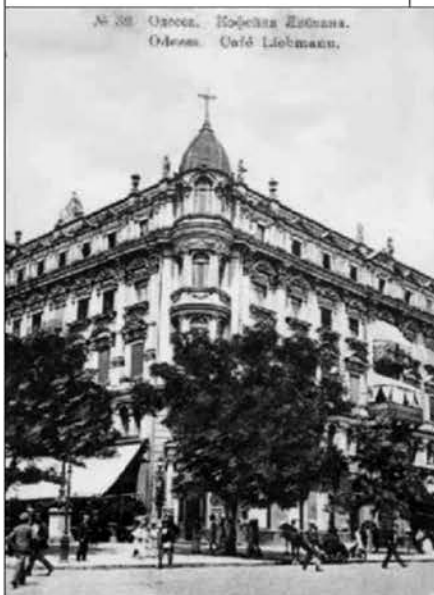
Рис.3. Дом Либмана. Арх. Э. Меснер, 1888 г.