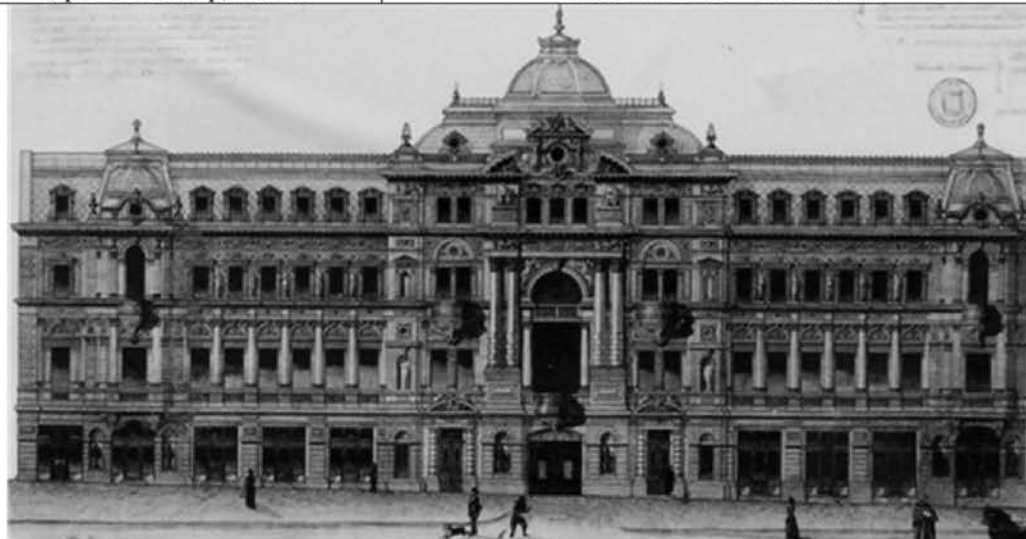
Рис.5. Главный фасад дома Руссова. Арх. В. Шмидт и Л.Чернигов, 1887 – 1898 гг.