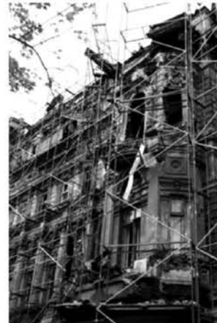
Рис.11 . Дом Руссова после пожара. Фото 2009 г.