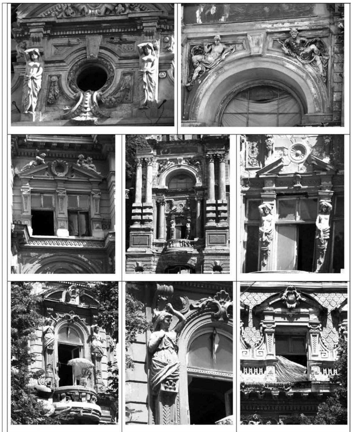
Рис. 6. Архитектурные детали на фасаде дома Руссова. Арх. В. Шмидт и Л. Чернигов, 1987 – 1998 гг. Скульптор Б. Эдуардс. Фото 2006 г.