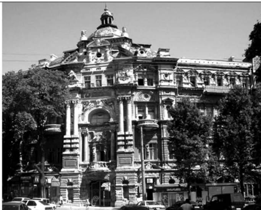
Рис.9 . Дом Руссова. Фото 2007 г.