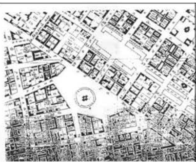
Рис.1. Генплан Одессы, 1828 г.