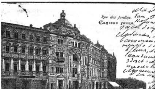
Рис.4. Вид на угол ул. Садовой и Преображенской. Фото кон. XIX – нач. XX вв.