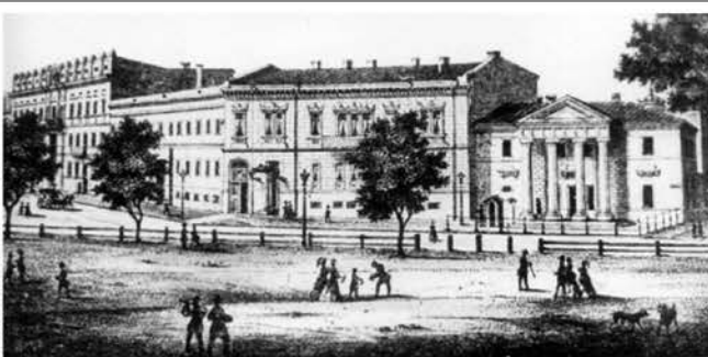
Рис.2. Вид на угол ул. Садовой и Преображенской. 1869 г.