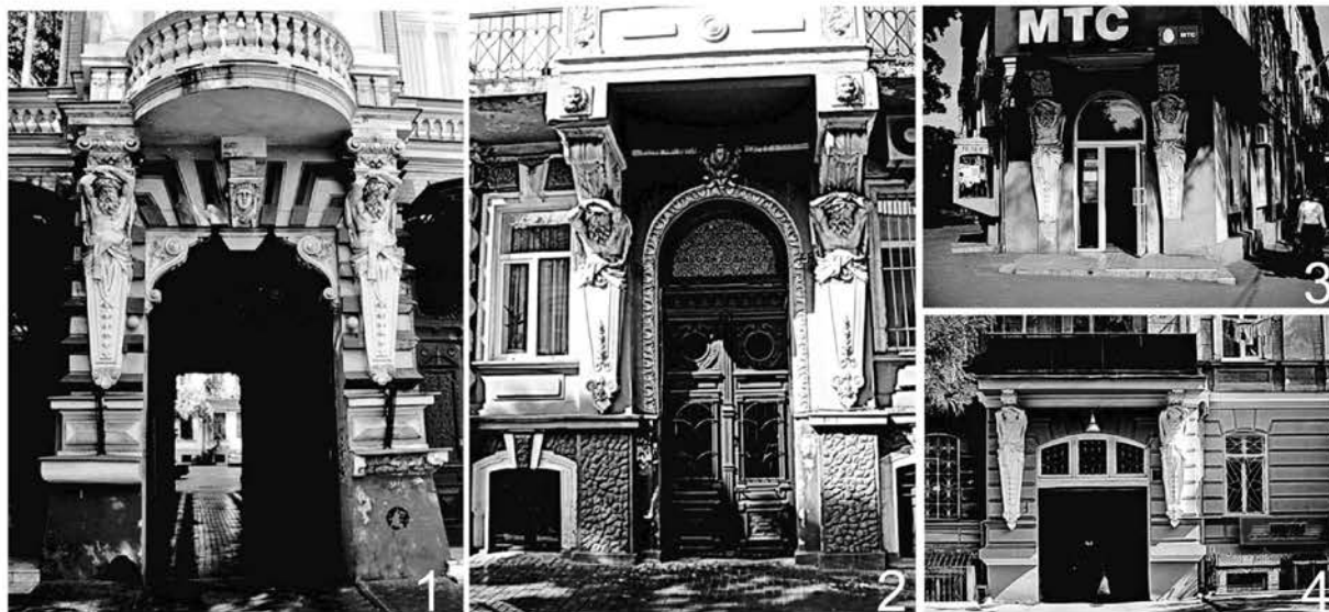
Рис. 2. Фрагменты фасадов жилых домов на ул. Гоголя, 14, ул. Преображенской, 5, ул. Преображенской, 17, ул. Щепкина, 1.