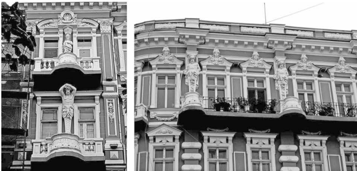
Рис. 1. Фрагменты фасада жилого дома, Екатерининская площадь, 3/4. Бывший особняк А. С. Стурдза