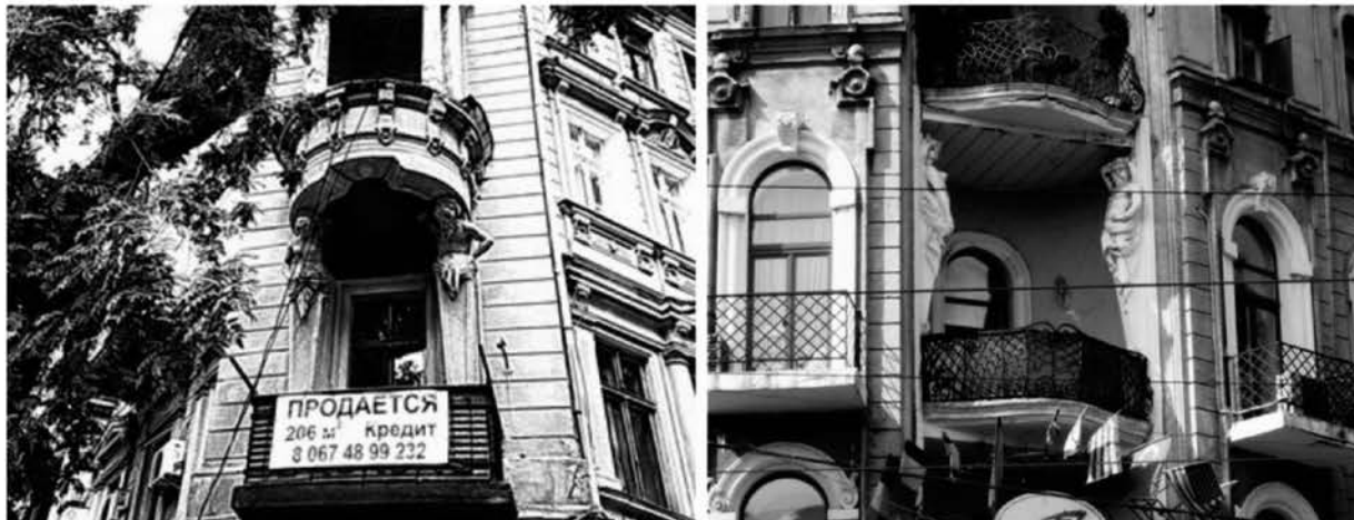
Рис. 4 . Фрагменты фасадов жилых домов на ул. Маразлиевской, 1, ул. Щепкина, 18.

Однако, атлант, являясь связующим композиционным элементом, объединяет различные уровни фасада, т. о., могут появиться и смешанные виды, такие как портально-балконные , (рис. 2), балконно-эркерные (рис. 4) и др.