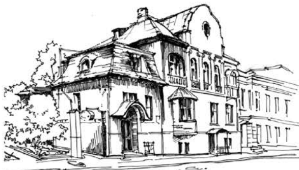
Ул. Дарвина. Застройка

свет и тьма – эти архетипические модели заставляют оставить логику игры в стили и окунуться в природу алогичного. Архитектурный ландшафт улицы достигает кульминации, связывая вид (картину) с его эмоционально-художественным смыслом. Интерпретация здесь выступает путем от морфологии вида к смыслу – эмоции.