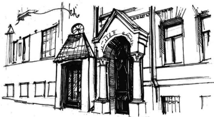
Порталы домов по ул. Дарвина

чающее относительно однородный участок или комплекс участков географической оболочки Земли, ограниченный естественными границами, в пределах которого природные и искусственные компоненты образуют взаимообусловленное единство. Географ А. П. Ковалев, возвращая понятие к его исходному значению, дает понимание ландшафта «как вида местности, как организации рисунка ее поверхности...» [3, с. 13]. Кроме географических, различают антропогенные, природные, культурные и другие ландшафты. Культурный ландшафт в документах ЮНЕСКО понимается как результат совместного творчества человека и природы. В архитектурной теории иногда выделяют понятие архитектурного ландшафта, трактуя его двояко. С одной стороны, его понимают как продукт ландшафтного дизайна, с другой – как вид, изображающий архитектуру. Представляется, что второе определение, ориентирующее на процесс восприятия архитектуры через восприятие архитектурных картин (видов), наиболее близко эстетической сути архитектуры. При этом становится важной образно-ассоциативная оценка архитектурного вида как феноменальной системы и как составной части пространственно-временных структур.