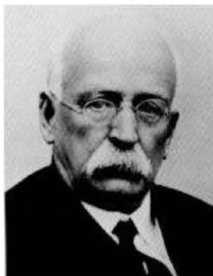
Рис.1. Эбенизер Говард (1850–1928гг.)

ящая из малоэтажной застройки с приусадебными участками. Города должны были образовывать более крупные группы с единым центром. Общее население такого «созвездия» городов должно было составлять порядка 250 тысяч жителей. Радиус зоны с жилой застройкой должен был составлять примерно один километр [1]. Это обеспечивало пешеходную доступность к различным зонам, необходимым для комфортной инфраструктуры города-сада (рис. 2).