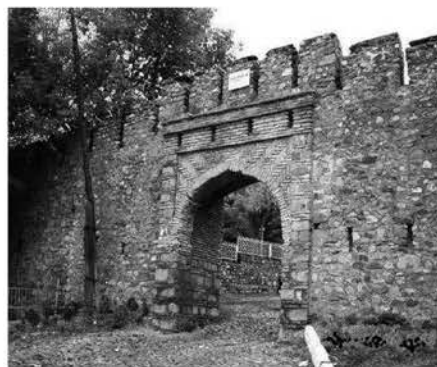
Рис.1. Шекинская крепость, Историко-Архитектурный заповедник «Юхары баиш»

В качестве другого примера можно привести здания на территории Шекинской крепости, которые недавно были переданы местным художникам под мастерские. В данном случае приспособление было ограничено созданием минимальных условий для работы, что не повредило самому памятнику.