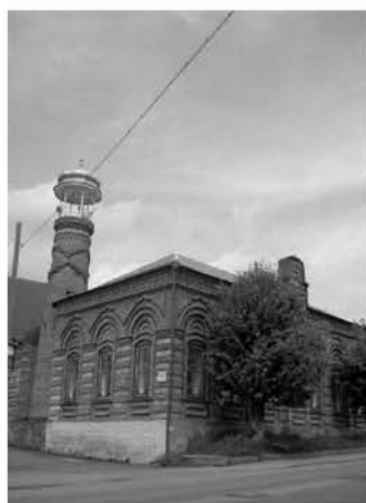
Рис. 3. Мечеть Омара Эфенди

В ходе проекта были получены интересные сведения об исторических этапах жизни памятника, определены основные строительные периоды. Были проведены археологическое исследование, архитектурно-археологический обмер и фиксация храма; работы по диагностике имевшихся разрушений и деформаций; реставрация и музеефикация памятника. Раскопки внутри и во дворе церкви выявили ряд интересных находок, в том числе многочисленные захоронения, остатки керамики, золотые и бронзовые украшения, свидетельствующие о многовековой жизни памятника как культурного центра. Кроме того, археологические исследования фундаментов памятника позволили определить дату возведения стен современной церкви – V век, а также подтвердили предположение о том, что они были построены на более древних многослойных фундаментах, под которыми находились остатки стен и фундаменты более древнего храма, относящегося к первым векам нашей эры. На территории церкви были проведены работы по благоустройству и озеленению. В сентябре 2003 года отреставрированный храм был открыт, и сегодня действует как музей истории и культуры Кавказской Албании – государства, существовавшего на территории современного северного Азербайджана.