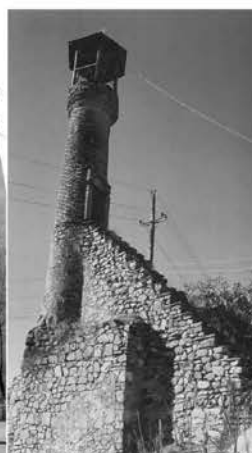
Рис. 5. Минарет несохранившейся мечети Гилейли