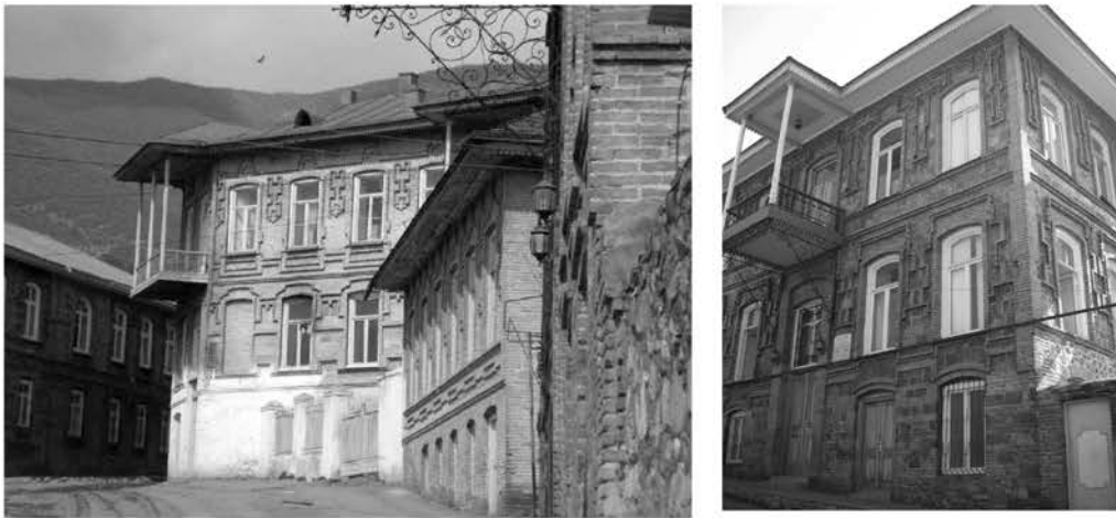
Рис. 7. Жилые дома

Как известно, на формирование планировочной структуры городов всегда оказывали влияние не только природные условия, но и важные, узловые градостроительные объекты: городские крепости и крупные ханские дворцы, иногда крупные Джума-мечети. Проводимые мероприятия по изменению среды и внедрению новых объектов всегда проводились с учетом существующей планировки. Новые здания, правильно вписываясь зодчими в уже существующую застройку, дополняли ее, формируя неповторимый колорит, характерный для городов региона. Они возводились с соблюдением пропорций и масштаба уже существующих архитектурных памятников, с обязательным сохранением традиционной целостности и гармонии исторической городской застройки. То есть архитектурные комплексы, городская застройка формировалась веками, вбирая в себя требования каждого нового поколения и решая современные для того времени вопросы формирования городов. Сегодня, в условиях нового этапа развития структуры города, необходимо мероприятия по регенерации и новое строительство вести со знанием множества аспектов, с максимально бережным отношением к исторической застройке.