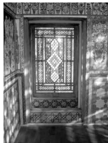
Рис. 8. Дворец Шекинских ханов

В Шеки, вследствие единовременности строительства, создалась известная целостность архитектурного образа, в отличие от других восточных городов, где обычно отсутствовал единый планировочный замысел. Планировочным центром Шеки является крепость—многоугольник сложной конфигурации, возведенный в 1790 г. на одном из городских холмов на основной магистрали города. К укреплению вплотную примыкала торговоремесленная часть города, постепенно переходящая в жилую застройку центра. В основном все памятники Шеки сконцентрированы на основной магистрали, ведущей вдоль реки от крепости вниз, в зоне, которая называется «Юхары баш» и является Историко-Архитектурным заповедником с 1968 года [3]. Здесь расположены караван-сарай, мечети, бани, мосты, самые известные жилые дома зажиточных владельцев и т. д. Пересекающие основную магистраль улочки также содержат очень интересные памятники.