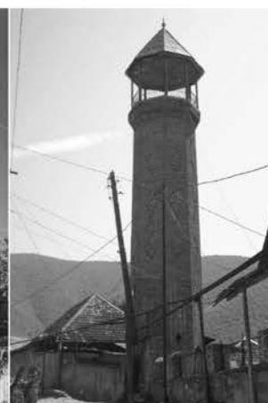
Рис. 6. Минарет мечети по ул. Агамалы

В условиях такого города, как Шеки, особо остро стоит вопрос регенерации, поскольку в настоящее время строительство здесь ведется интенсивно. К сожалению, новое строительство начало разрушать образ исторического Шеки – города домов с глубокими верандами, яркими черепичными кровлями и зелеными садами, переходящими в зелень окружающих его гор и лесов. Процесс нынешней регенерации города вполне закономерен, поскольку новые условия жизни требуют нового осмысления городской структуры, отношения к исторической среде.