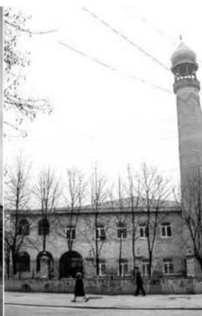
Рис. 4. Джума-мечеть