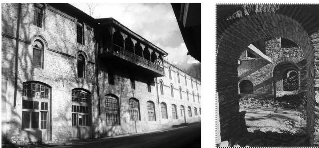
Рис. 9. Нижний Караван-сарай до реставрации