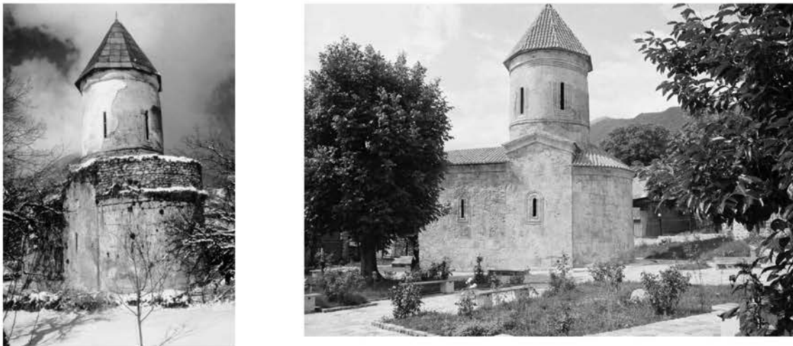
Рис. 2. Церковь в селении Киши до и после реставрации

К сожалению, большое количество проблем, связанных с охраной наследия, не всегда позволяет своевременно решать их на государственном уровне. Особенно это касается памятников республиканского или местного значения. В некоторых случаях целесообразна передача некоторых объектов в «частные руки» для реставрации и дальнейшего приспособления. В настоящее время обсуждается вопрос передачи нескольких памятников, в том числе и комплекса Дворца Шекинских ханов и других объектов культурного наследия [2]. Хорошие результаты подобного решения мы наблюдаем во многих городах и странах, когда памятники всемирного наследия находятся в руках отдельных частных владельцев. Правильная организация контроля состояния памятников и их охраны, а также адекватная оценка владельцем своих обязанностей в отношении памятника, позволяют не только продлить жизнь памятника, но и использовать его и популяризовать. К сожалению, недостаточная правовая база для регламентированной охраны архитектурного наследия усложняет реализацию этого решения в нашей стране, поскольку в случае подобного решения необходимо наличие четкой системы охраны и контроля работ по сохранению и приспособлению памятников.