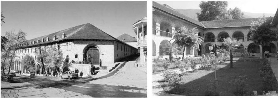
Рис. 9. Верхний Караван-сарай

Все это требует расширения границ охранной зоны и освобождения её от случайных построек. Реставрационные работы, периодически ведущиеся на памятниках, и их приспособление к новым функциям способствуют сохранению памятников. Однако для полного решения проблем необходимо проведение крупномасштабных реставрационных и консервационных мероприятий, а также работ по благоустройству на всём протяжении исторической улицы и прилегающих кварталов. Срочного проведения реставрационных работ требуют Дом Шекихановых, торговые постройки на мосту, другие исторические здания, тянущиеся вдоль правого берега реки до Джума мечети.