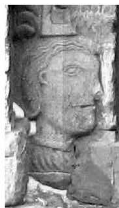
Рис. 5г. Пошкоджені чоловічі портрети на обрамленнях порталу каплиці