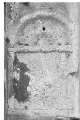
Рис. 3в. Пошкоджені деталі південного portalу

Північний портал, виготовлений із замкового каменю в стилі ренесанс. Правильно вивірені пропорції та гармонія орнаментики свідчить про високу майстерність митців епохи ренесансу (рис. 4а). В оздобленні використано притаманний українському декоративному мистецтву рослинний мотив, де чергуються стилізовані квіткові розети з прямокутним плетенням. Портал завершується лінійним сандриком, оздобленим замкненим у композиції слов'янським надписом, що означає: “Ці ворота Господні православні для вас” (рис. 4б). Розетка заповнена декоративним мотивом у вигляді квітки з однаковими пелюстками, які розташовані по краях portalу. Узор прямокутного плетення складається з ритмічно впорядкованих елементів, підкреслює архітектуру portalу. Таких плетень на порталі є шість, з яких чотири переплетені трьома лініями.