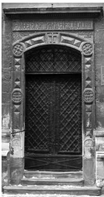
Рис. 3а. Південний портал Успенського храму