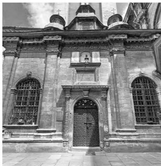
Рис. 2. Трисвятительська каплиця

Південний і північний входи Успенського храму оздоблені кам'яними різьбленими порталами з орнаментами різного малюнку з витонченим трактуванням поверхонь, що заслуговують особливої уваги.