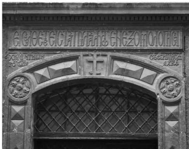
Рис. 3б. Фрагмент південного portalу