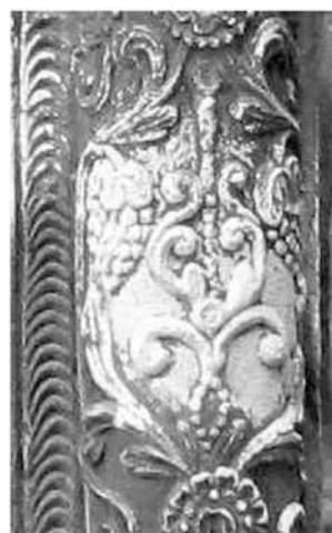
Рис. 5б. Пошкоджений фрагмент орнаментики на півколоні порталу Трисвятительської каплиці