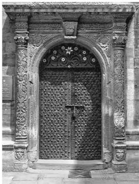
Рис. 5а. Портал Трисвятительської каплиці

колір білого вапняку, зумовлений покриванням каменю свинцевими білилами, що було колись розповсюдженим явищем, які під дією повітря втягують пил з навколишнього середовища і темніють з часом).