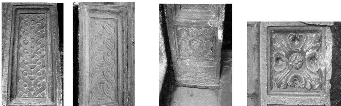
Рис. 4в. Пошкоджені плетения та розета в нижній частині північного portalу

Каплиця Трьох святих споруджена в 1578–1590 рр. архітектором А. Підлісним, фундатором якої був К. Корнякт, на місці двох дерев'яних попередниць (дерев'яної церкви Трьох Святих та дерев'яної каплиці) [2] (рис. 2). Після пожежі 1671 р. каплицю відбудував на свої кошти О. Балабан, про що свідчить надпис грецькою мовою над порталом вхідних дверей [3]. В планувально-просторовій структурі архітектоніка будівлі відзначається надзвичайною простотою. В основі її лежить прямокутний об'єм, характерний для класичних зразків ренесансної архітектури. Високі, гладкі стіни розчленовано тосканськими пілястрами на три прясла. Призматичний низ каплиці прорізаний великими арковими вікнами, має характерні для ренесансу ордерні членування, що відповідають трибальному завершенню споруди, запозиченому з практики багаточисельних українських дерев'яних храмів.