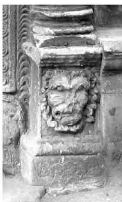
рис. 5в. Пошкоджені маскарони левів на базах півколонок порталу каплиці