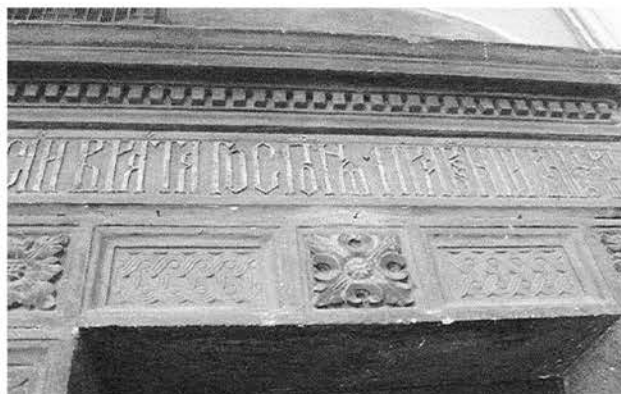
Рис. 4б. Фрагмент portalу з пошкодженим карнизом