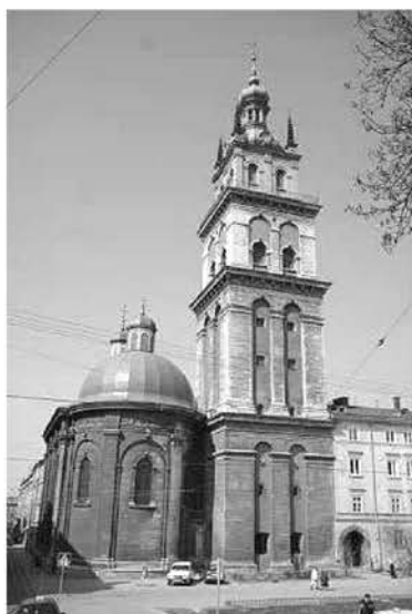
Рис.1. Комплекс Успенської церкви у Львові

Успенський храм відкритий для огляду зовні зі сторони вулиць Підвальної та Руської. Величний об'єм церкви складається з короткого прямокутного західного нартекса з хорами на другому ярусі, тридільної чотиристовпно видовженої нави та напівкруглої вужчої апсиди, розташованих на одній осі. Храм увінчаний трьома сферичними банями з високими ренесансними ліхтарями й маківками. В архітектурному декорі фасадів храму використано елементи ренесансної ордерної системи: стіни розчленовані тосканськими пілястрами на симетричні поля, в кожне з яких вписано глухі півциркульні арки з ритмічно розміщеними вікнами з архівольтами. Під енергійно окресленим карнизом тягнеться доричний фриз, в якому тригліфи чергуються з метопами. Поля метопів доричного фризу заповнені різьбленими в камені стилізованими розетами і сюжетними композиціями на біблійні і євангельські теми (рис. 1).