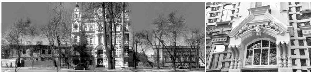
Рис. 7. Маразлиевская, 54. Доходный дом Н. Н. Крыжановского-Аудерского, 1900 г., арх. Л. Л. Влодек. Общий вид здания, фрагмент фасада