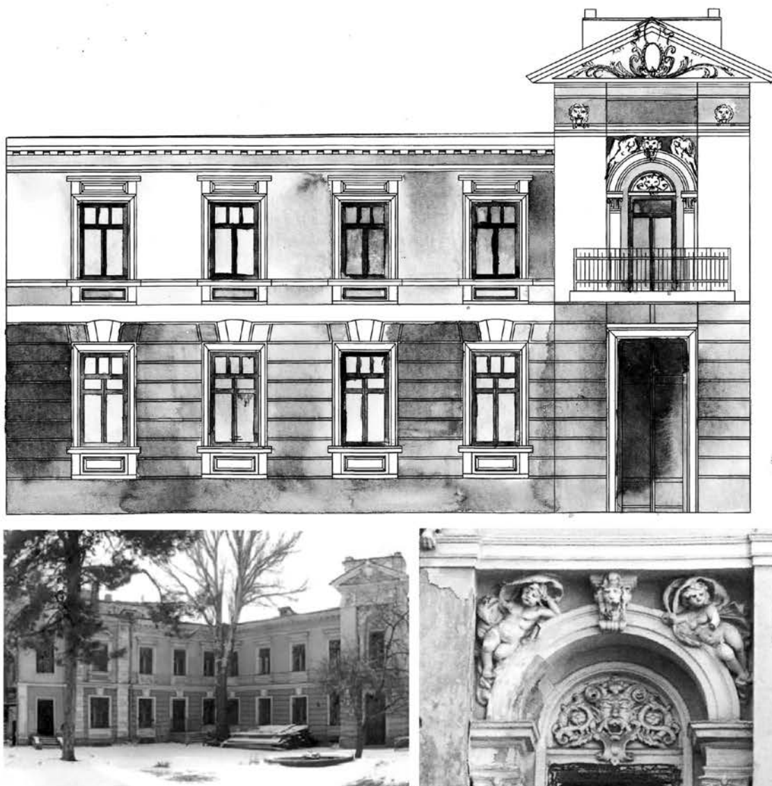
Рис. 5. Маразлиевская, 18. Особняк Менделевича, 1880-е гг., арх. Л. Л. Влодек. Фрагмент фасада, общий вид, входная ниша

Полученные результаты носят практическое и просветительское значение. Позволяют сформировать рекомендательную базу по восстановлению и реставрации памятников архитектуры, помогают укрепить уважение и привязанность жителей города к архитектурному наследию минувших эпох, демонстрируя разнообразие художественных образов и вариативность пластических решений.