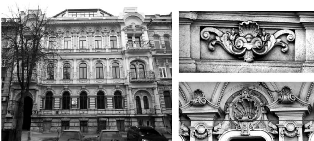
Рис. 6. Маразлиевская, 4. Доходный дом Озмидова, 1899 г., арх. Ю. М. Дмитренко. Общий вид здания, фрагменты декоративной пластики