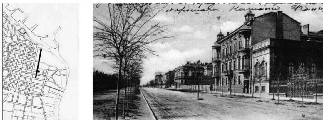
Рис. 2. Фрагмент развертки улицы. Силуэт застройки

Интенсивный пластический декор поля стены исследуемых объектов в комбинации с сомасштабным человеку силуэтом застройки (рис. 2.) сформировал насыщенную информационную среду. Обилие сохранившихся аутентичных фрагментов эпохи историзма позволяет не только передавать информацию, но и регенерировать её. В такой среде происходит безусловный поисковый анализ, осмысление аналогов и прообразов [6]. Это приводит к духовному и эстетическому обогащению жителей города. Факторы, влияющие на формирование и восприятие фасадной поверхности (рис. 3), являются неотъемлемой основой «диалога» между человеком и архитектурой. «Чтением» архитектуры через значение эмоционально-эстетических символов, а также образов метафор занимается векторная семиотика. В работах Ю. Лотмана пространственная семиотика всегда имеет векторный характер [3]. А. Барабанов, исследуя семантику отношений человека и архитектуры, особое внимание обращает на символику линий форм и фигур. Данное исследование особенно актуально для декоративной пластики и силуэтов периода историзма, т. к. пластический декор наполнен различной символикой, мифологическими, растительными, зооморфными и антропоморфными рельефами.