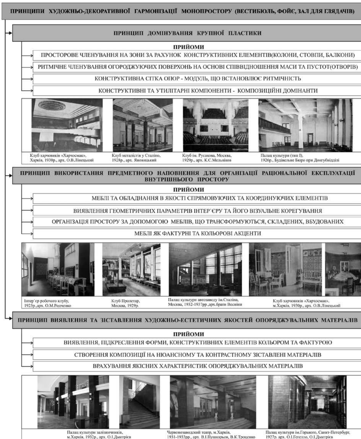
Рис. 4. Принципи художньо-декоративної гармонізації монопростору (вестибюль, фойє, зал для глядачів) архітектурного авангарду

опоряджувальні матеріали, елементи наповнення. Інтер'єри даного періоду відрізняються особливою тектонічною виразністю. Орнаментально-пластичні деталі практично не застосовувались, а функціонально-технічні задачі вирішувались як художні. На основі конструктивного методу сформувались певні принципи художньо-декоративної гармонізації монопростору (див. рис. 4).