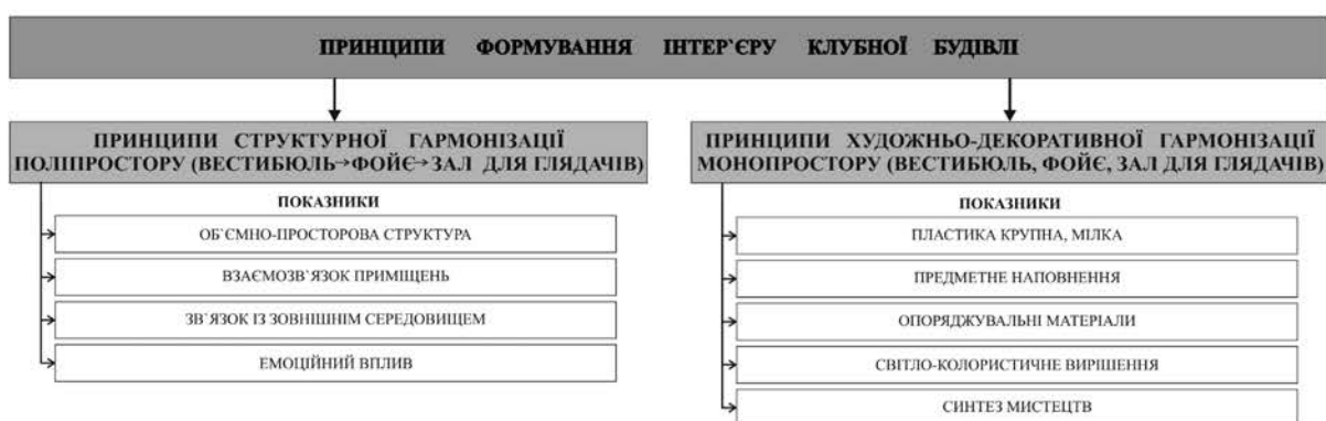
Рис. 2. Теоретична модель визначення принципів формування інтер'єру клубної будівлі

Наступним етапом є визначення структурних рівнів внутрішнього простору клубної будівлі. Приміщення видовищної частини утворюють поліпростір, складові якого мають функціональні та візуальні зв'язки. Характер цих зв'язків є основою для визначення принципів структурної гармонізації поліпростору. Для виявлення прийомів та принципів їх узгодження за основу взяті: об'ємно-просторова структура, взаємозв'язок приміщень, зв'язок із зовнішнім середовищем та емоційний вплив. Серед компонентів архітектурного простору, що розглядаються в даній роботі, наступні монопростори: вестибюль, фойє, зал для глядачів. Принципи художньо-декоративної гармонізації даних приміщень визначаються за сукупністю властивостей таких показників: пластика мілка та крупна, предметне наповнення, опоряджувальні матеріали, світло-колеристичне вирішення, синтез мистецтв. На основі цього пропонується теоретична модель визначення принципів формування інтер'єру клубної будівлі (рис. 2).