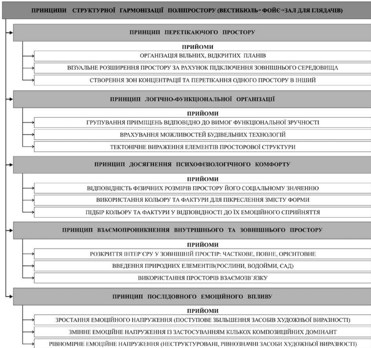
Рис. 3. Принципи структурної гармонізації поліпростору видовищної частини клубної будівлі архітектурного авангарду

цип досягнення психофізіологічного комфорту. Принципи та прийоми структурної гармонізації поліпростору видовищної частини клубної будівлі архітектурного авангарду представлено на рис. 3.