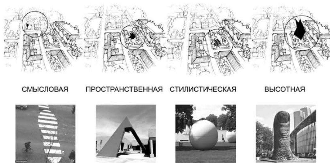
Рис.2. Классификация доминирующих объектов по типу доминирования

Системная модель понятия «архитектурная доминанта», в свою очередь, позволила составить таблицу классификации доминирующих объектов по типу доминирования (рис. 2).