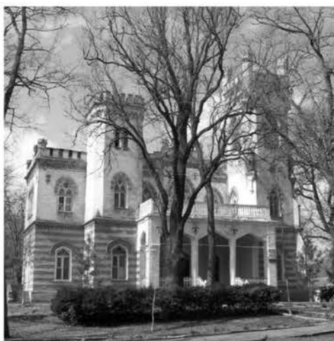
Рис.7. Дача Параскева, 1891–1892 гг., арх. П.У. Клейн. Фото автора 2012 г.