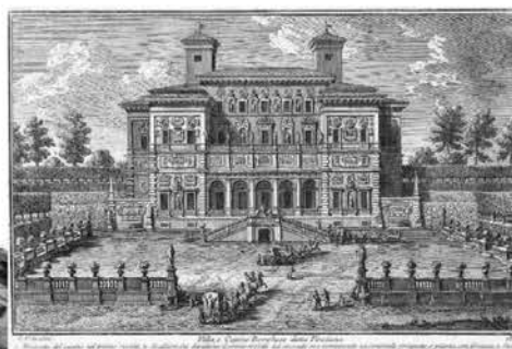
Рис. 2. Вилла Боргезе. 1613 г. Арх. Дж. Вазари