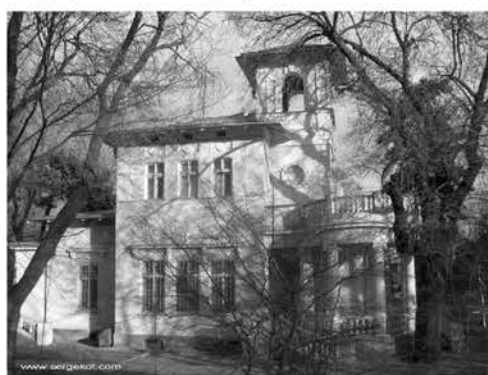
Рис. 5. Дача Бруни, конец XIX в. Фото [9]