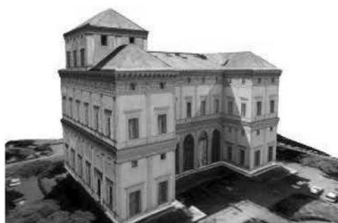
Рис. 1. Вилла Фарнезина. 1511 г. Арх. Бальдассаре Перуцци

Одним из часто встречающихся элементов объёмно-пространственной композиции одесских дач является башня. Башня, как композиционный элемент виллы, пришла из архитектуры итальянского Ренессанса. В архитектуру Ренессанса башня, в свою очередь, «перекочевала» из средневековья, где она выполняла оборонительную функцию, кроме того, башня должна была подчеркнуть знатность рода и высокое общественное положение владельца дома. Функцию символа феодальной власти и древнего происхождения рода башня сохранила и в виллах Нового времени. Башня появляется «в проектах некоторых вилл у А. Палладио – это вилла Серего, вилла Пизани, вилла Репета (в натуре во всех этих виллах башни осуществлены не были) и др.» [6, с. 3]. Не только Палладио включал в композицию виллы башню, это и Бальдассаре Перуцци (вилла Фарнезина) (рис. 1), и Виньола (вилла Капрарола), и Джорджо Вазари (вилла Боргезе) (рис. 2), и другие мастера Возрождения. В ренессансной вилле башня претерпевает трансформацию от средневековой башни-донжона до башни-павильона, часто называемого «бельведер», и угловых ризалитов, и в таком виде распространяется в архитектуре других европейских стран.