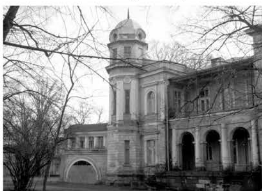
Рис. 4. Дача Маразли-Кич, 1880–1890гг., арх. Ф. В. Гонсиоровский.