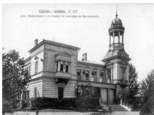
Рис. 6. Дача Маврокордато, конец XIX в., арх. Ю. М. Дмитренко. Фото [8]. Фото автора, 2012 г.