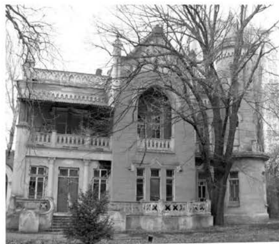
Рис. 8. Дача Анатра. 1913 г. арх. Ю. М. Дмитренко.