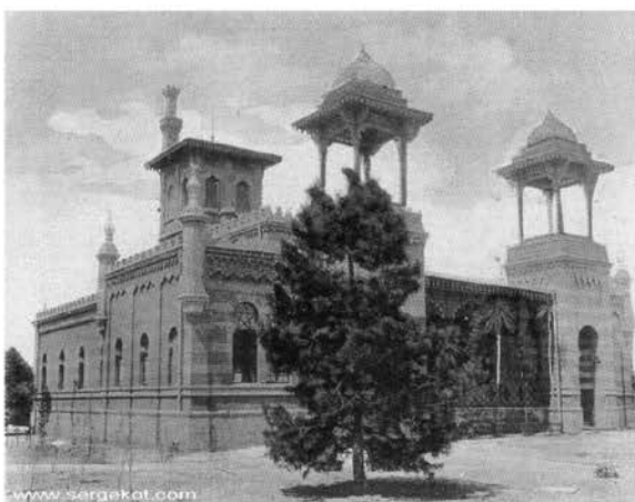
Рис. 9. Здание гидропатической лечебницы Одесской Санатории, 1890-е гг. Арх. ? Старинная открытка