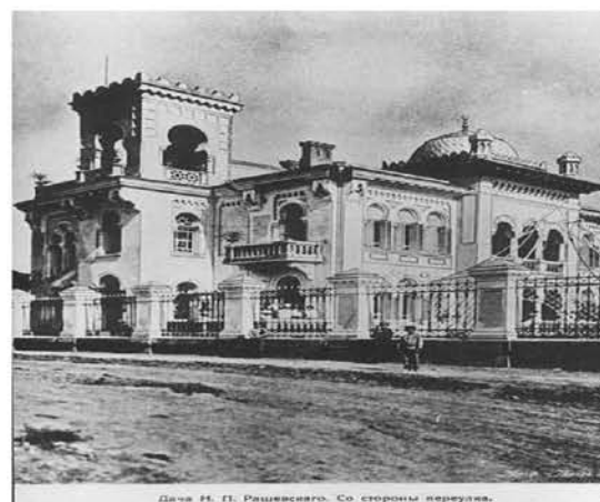
Рис. 10. Дача Макареско (дача Рашевского), 1890-е гг., арх. В. И. Шмидт. Фото [9]