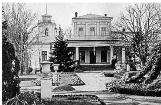
Рис. 3. Дача Мартыновой. Фото 1910-х гг. [9]. 2012 г.

В архитектуре одесских дач историзма этот «римский мотив» стал очень популярен в независимости от стилистики фасадов здания. Мотив башни присутствовал в постройках «итальянского стиля»: дача Мартыновой (рис. 3), дача Маразли-Кич (рис. 4), дача Бруни (рис. 5), дача Маврокордато (рис. 6). В зданиях, стилистика фасадов которых возникла на основе средневековых стилей и восточных влияний: дача Параскева (рис. 7), дача Анатра (рис. 8), дача Макареско (рис. 9), гидропатическое заведение Одесской Санатории (рис. 10). 2