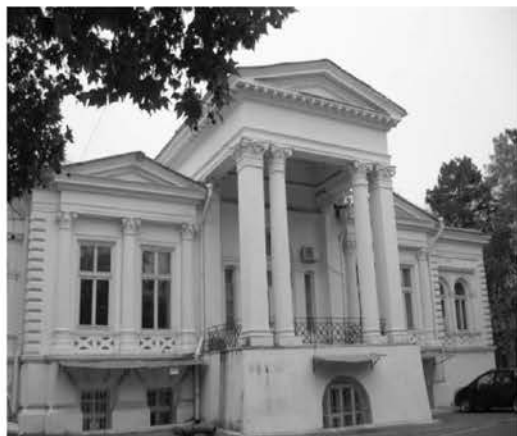
Рис. 11 Дача Ашкенази, 1901 г., арх. В. И. Прохаска.