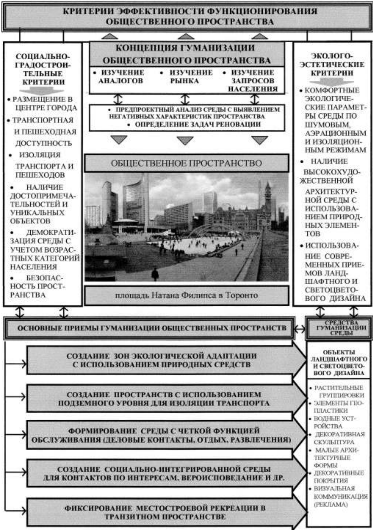
Критерии и приемы гуманизации общественного пространства