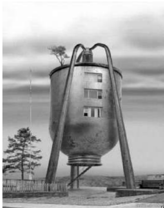
Рис. 7. Стилпанк в архитектуре