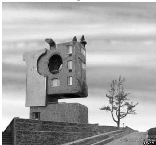
Рис. 6. Стилпанк в архитектуре