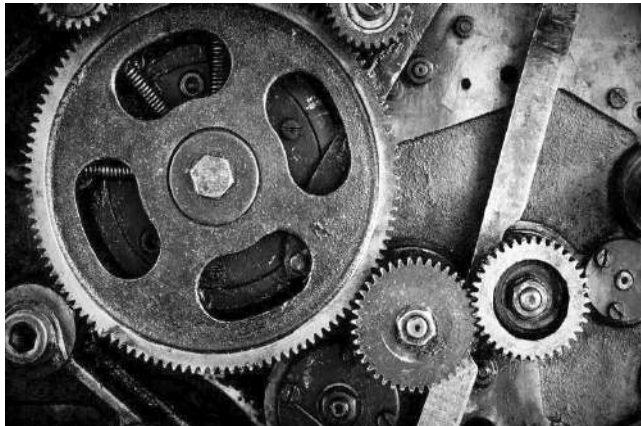
Рис. 8. Фотопанно на стену в стиле стилпанк.