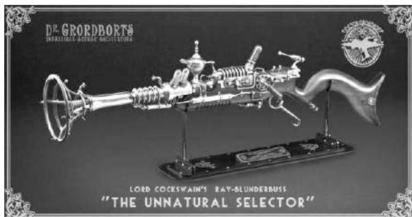
Рис. 1. Стилпанк в графике