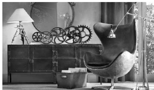
Рис. 2. Стилпанк в дизайне интерьера