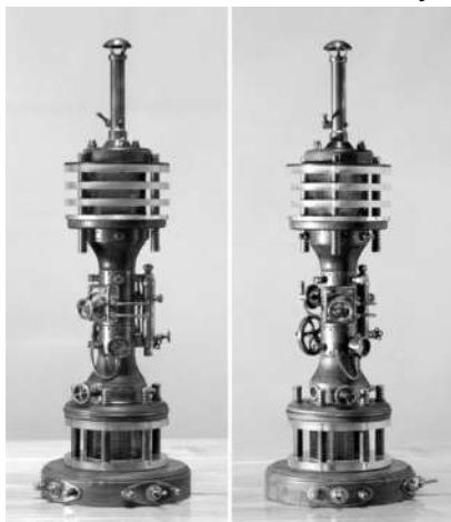
Рис. 5. Стилпанк в предметном дизайне