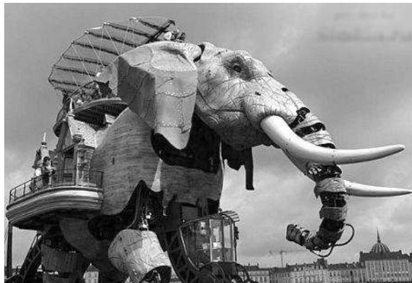
Рис. 3. Стилпанк в механической скульптуре