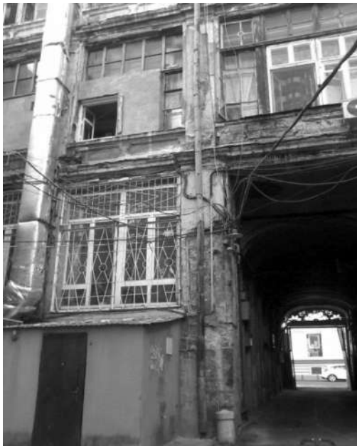
Рис.3. Дом Страца, ул. Пастера, 26

Яркими примерами таких зданий в историческом центре города являются: