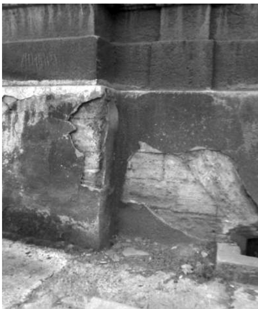
Рис.5. Бродская синагога ул. Жуковского, 18