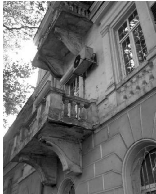
Рис.4. Дом Маразли, ул. Пушкинская, 4