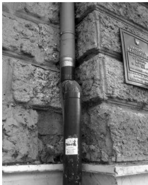
Рис.6. Доходный дом Курле, ул. Пушкинская, 28

Причинами повреждения гидроизоляционного слоя чаще всего являются: несоблюдение технологии устройства гидроизоляции; зачастую отсутствие ее, низкое качество материала; изменение уровня грунтовых вод; неправильно выбранный тип гидроизоляции; низкая прочность сцепления с основанием; работы по основанию с чрезмерно высокой влажностью; нарушение дозировки компонентов гидроизоляционного состава; деформация, вызванная смещением отдельных конструктивных элементов здания относительно друг друга и т.п. А также практика эксплуатации зданий показывает, что разрушение швов, и как результат, нарушение сплошности гидроизоляции – одна из основных причин преждевременного износа сооружений, увеличения расходов на